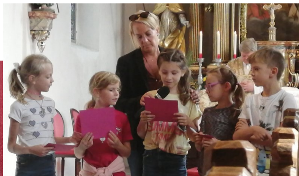
Eine Schatzkiste mit Geschenken für die Schulanfänger