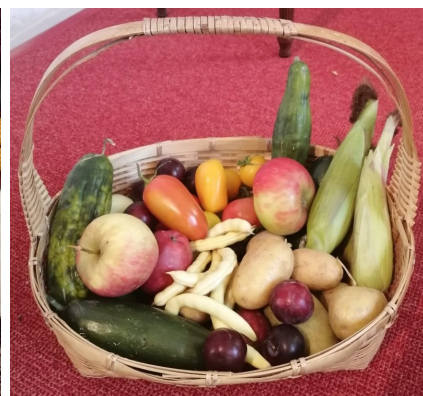
Am Ende der Hl. Messe konnte jeder etwas von den gesegneten Erntegaben mit nach Hause nehmen.