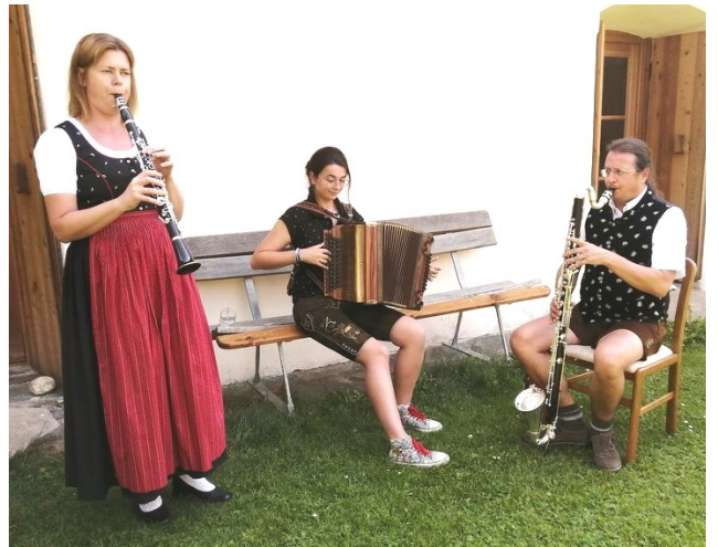
Frauensinggruppe Arriach und Klarimoni Musi