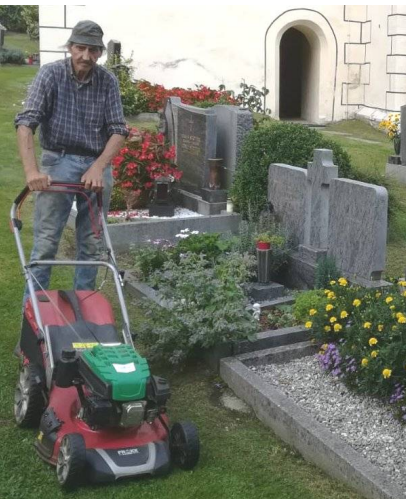
Der Mesner von Afritz im Einsatz

An dieser Stelle möchten wir uns einmal sehr herzlich bei allen Helfern in den Pfarren Afritz, Arriach und Innerteuchen bedanken. Mit vielen Stunden Einsatz im Jahr werden Sonntag für Sonntag die Mesnerdienste in der Kirche verrichtet, auch bei Begräbnissen, Trauungen und Taufen. Die Friedhöfe und Wiesenflächen müssen regelmäßig gemäht werden, die Kirchen geschmückt und gereinigt. Die Pfarrblätter werden gefaltet und von vielen fleißigen Austrägern alle zwei Monate in die Häuser getragen. In Arriach bereitet unsere Organistin die Lieder vor und begleitet die Hl. Messe auf der Orgel, auch diverse Blütenkränze und Kirchenschmuck fertigt sie an. Für die Pfarrcafes in den Pfarren werden Kuchen und Brote gerichtet, die Tische gedeckt und anschließend wieder abgewaschen und weggeräumt. Auch in der Vorbereitung der großen Feste stecken viele Arbeitsstunden.