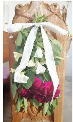
Kirchenbankschmuck zum Erntedankfest in Arriach

Unzählige große und kleine Dienste sind es, die hier geleistet werden und meist unbemerkt bleiben. Es werden hier keine Namen genannt und wahrscheinlich ist die Aufzählung der Arbeiten auch unvollständig, aber allen, die das Leben in unseren Pfarren so unterstützen, soll hier einmal ein herzliches Vergelt's Gott gesagt werden.