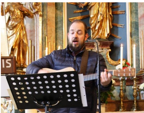
Musikalische Gestaltung von Martin Sabitzer