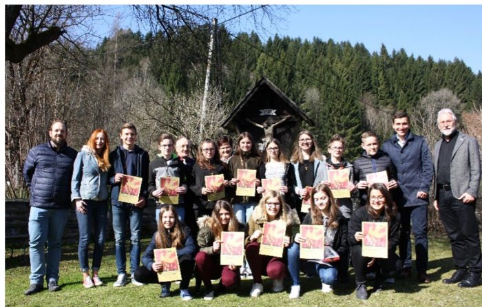
Unsere Firmkandidaten 2018 mit den Firmbegleitern