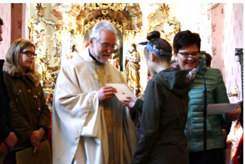
Übergabe der Spenden von € 600.-der „Coffee to help“ Aktion der Firmlinge an den Caritasdirektor.