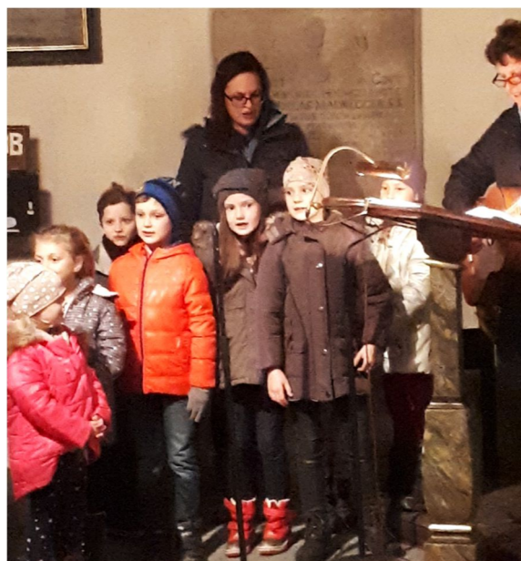
Kinderchor bei der Martinsfeier