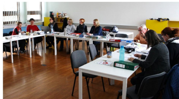
Pfarrgemeinderatsklausur 3.-4.11. in Eberndorf