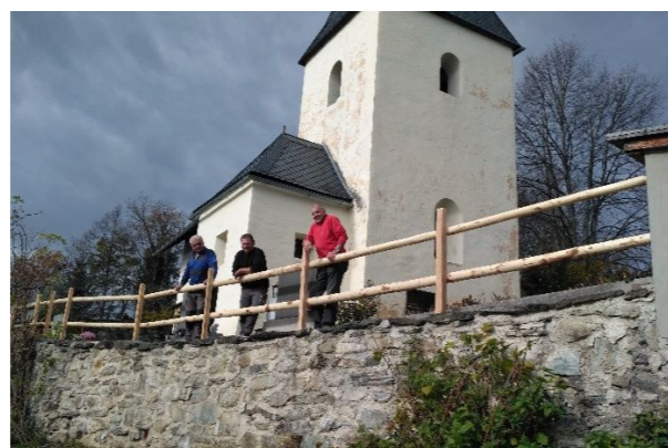
Errichtung des Holzzaunes bei der Werschlinger Kirche

Adventsingen in der Pfarrkirche Himmelberg mit dem Volkliedchor Himmelberg unter der Leitung von Erika Zwischenberger Sonntag, 10. Dezember 2017 um 15:00 Uhr