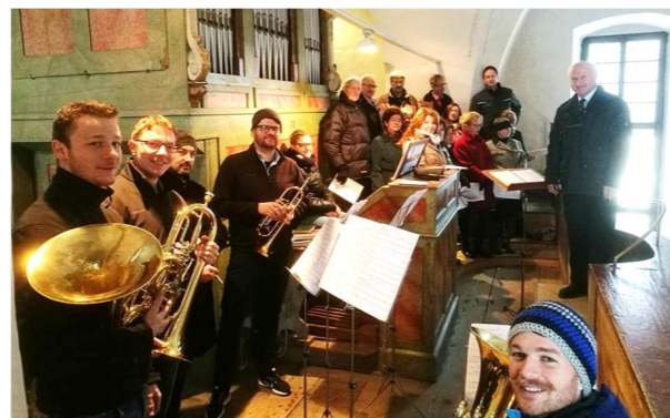
Cäcilienmesse mit dem Kirchenchor und den Brassstronauten am Christkönigssonntag 26.11.