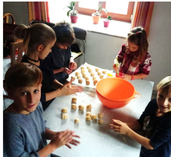
Ministranten backen Martinibrote