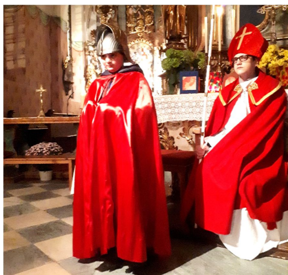
Martinsspiel mit Kindern der Volksschule