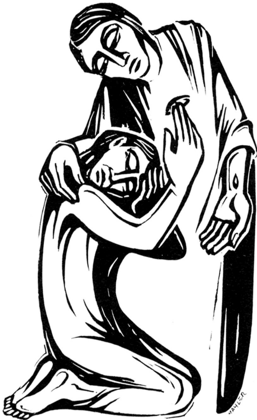
Dieses Bild möchte angemalt werden