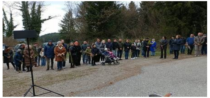
05.04.2026 – Auferstehungsfeier Heuer war die Kirche seit langer Zeit wieder bis zum letzten Platz voll.