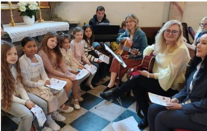
Schülerinnen und Lehrerinnen anlässlich der Erstkommunionsfeier in Tainach