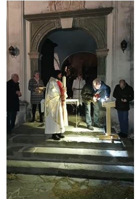
04.04.2026 – Feuerweihe in Tainach und Wabelsdorf Osterspeisensegnung in Wabelsdorf und Tainach