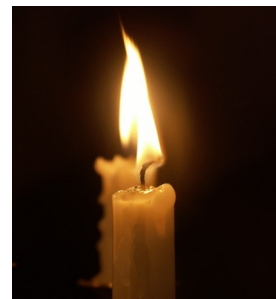
Adelheid Magnet †20. April 2026 80 Jahre