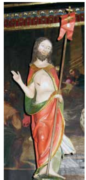
Der Auferstandene in der Pfarrkirche St. Martin