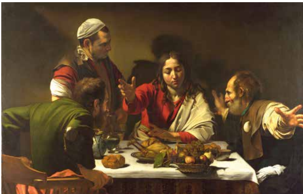
Das Abendmahl in Emmaus (Michelangelo Merisi da Caravaggio)

Der Tod löscht Leben unwiderruflich aus. Was bleibt, ist die Erinnerung. Wer einen geliebten Menschen verliert, empfindet tiefe Trauer. Leere begleitet den Alltag. Arbeit und Zerstreuung sind Versuche, gegen den Mangel anzukämpfen. Das Beckern der Seelenlandschaft wird mit Eifer betrieben, doch die Saat will nicht aufgehen. Der Kummer ist ein schlechter Dünger. Die dankbare Erinnerung entdeckt wohltuende Rituale. Das Entzünden einer Kerze steht für wertschätzendes Gedenken. Der Tisch bleibt weiterhin für den Verstorbenen gedeckt. Zum Geburtstag wird seiner besonders gedacht. Das Stück Torte darf nicht fehlen. Für ihn wird es verzehrt. Es wird in dankbarer Erinnerung gegessen. Vielleicht wird auch nur auf ihn angestoßen? Der Symbolwert ist groß. Der Tote wird gleichsam ins Leben zurückgeholt, er ist Teil der Tischgemeinschaft. Das Ritual tut der Seele gut. Die Erinnerungskultur ist Beziehungspflege und holt den Toten ins Leben zurück. Was auf der Seele liegt, ist wesentlicher Teil