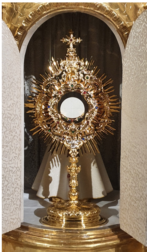
Foto: Monstranz der Pfarre Mühlendorf

Würden wir ihn sehen, dann könnten wir als sterbliche Menschen seine Herrlichkeit gar nicht ertragen! So hat er sich selbst verborgen in der Gestalt des Brotes , und die einzige Möglichkeit, ihn mit den Augen des Herzens zu „sehen“ oder „anzuschauen“, ist an ihn zu glauben. „Selig, die nicht sehen und doch glauben.“