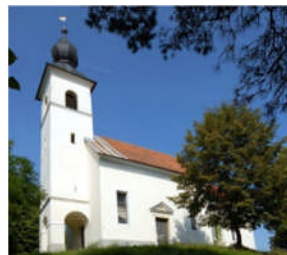
Wallfahrtskirche Freudenberg Maria Sieben Schmerzen