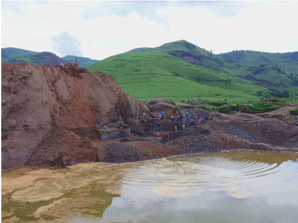
Coltanabbau Kongo, Mine in Fungamwaka.

Der Abbau von Tantal zerstört die Umwelt, verändert die Naturlandschaft und hinterlässt giftige Rückstände. Im Osten des Kongos stehen viele Bergbauminen unter der Kontrolle bewaffneter Gruppen, die ihre Kriege aus den Gewinnen finanzieren.