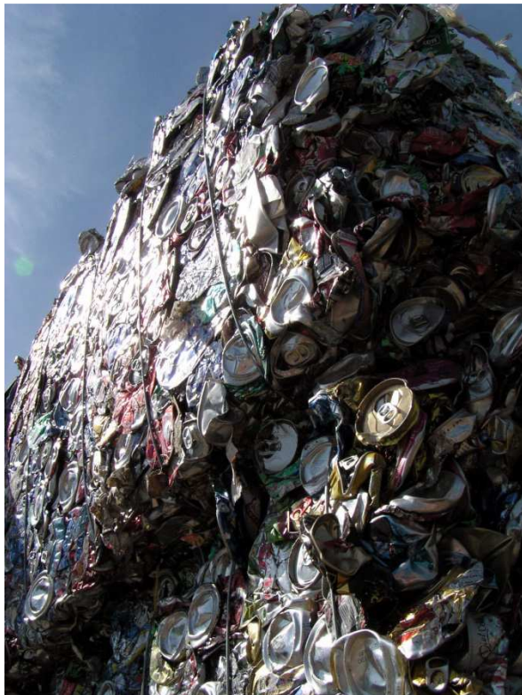
2000 Pfund-Würfel aus Aluminiumdosen.

Doch die Nachfrage nach Dosen, Alufolien, Deo-Sprays und vielem mehr wächst – und damit der Abbau von Bauxit und die Herstellung von neuem Alu. Dieser Hunger nach Aluminium hat viele Schattenseiten. Ein großer Teil der Bauxitvorkommen lagert in den Regenwaldländern. Riesige Waldflächen werden gerodet und der Boden abgetragen, um an das Gestein zu kommen.