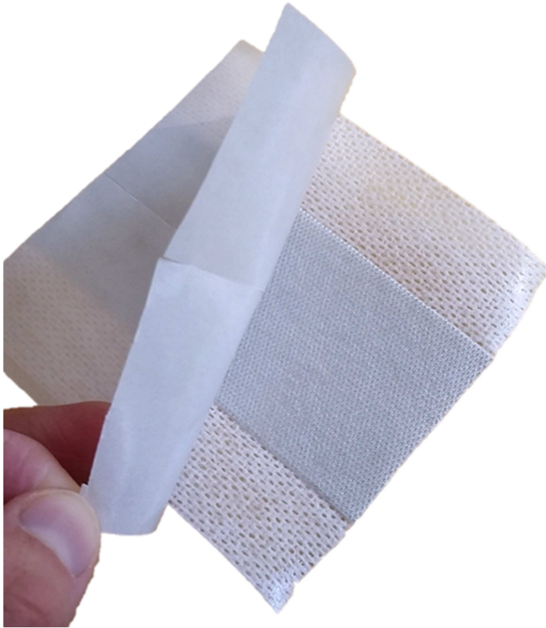
Pflaster sensitiv, antiseptisches Silber.

Außerdem hat es eine hohe Abschirmungswirkung gegenüber elektromagnetischer Strahlung. Darum ist es ein wichtiger Werkstoff in der Technik. Neben weiteren nützlichen Eigenschaften ist Silber antibakteriell und fungizid. Deshalb wird es in der Medizin zum Beispiel für Wundauflagen und Spezialkleidung verwendet.