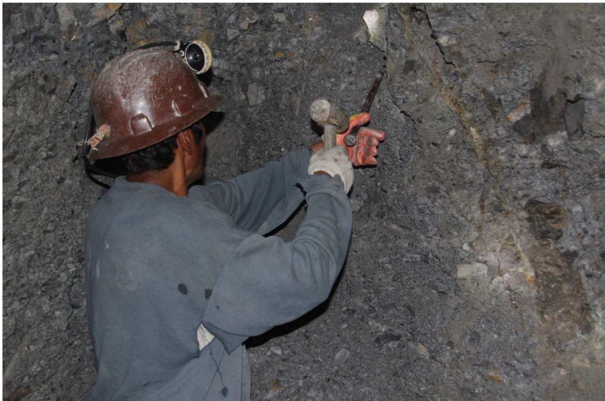
Bolivien, Cerro Rico -Reicher Berg, Silber und Zinkabbau.

Es ist anzunehmen, dass die Silbervorkommen in einem überschaubaren Zeitraum zu Ende gehen werden. Wahrscheinlich reichen sie nur noch für 30 bis 50 Jahre. Allerdings wird heute in weit größerem Umfang Silber recycelt und dadurch werden die Ressourcen gestreckt.