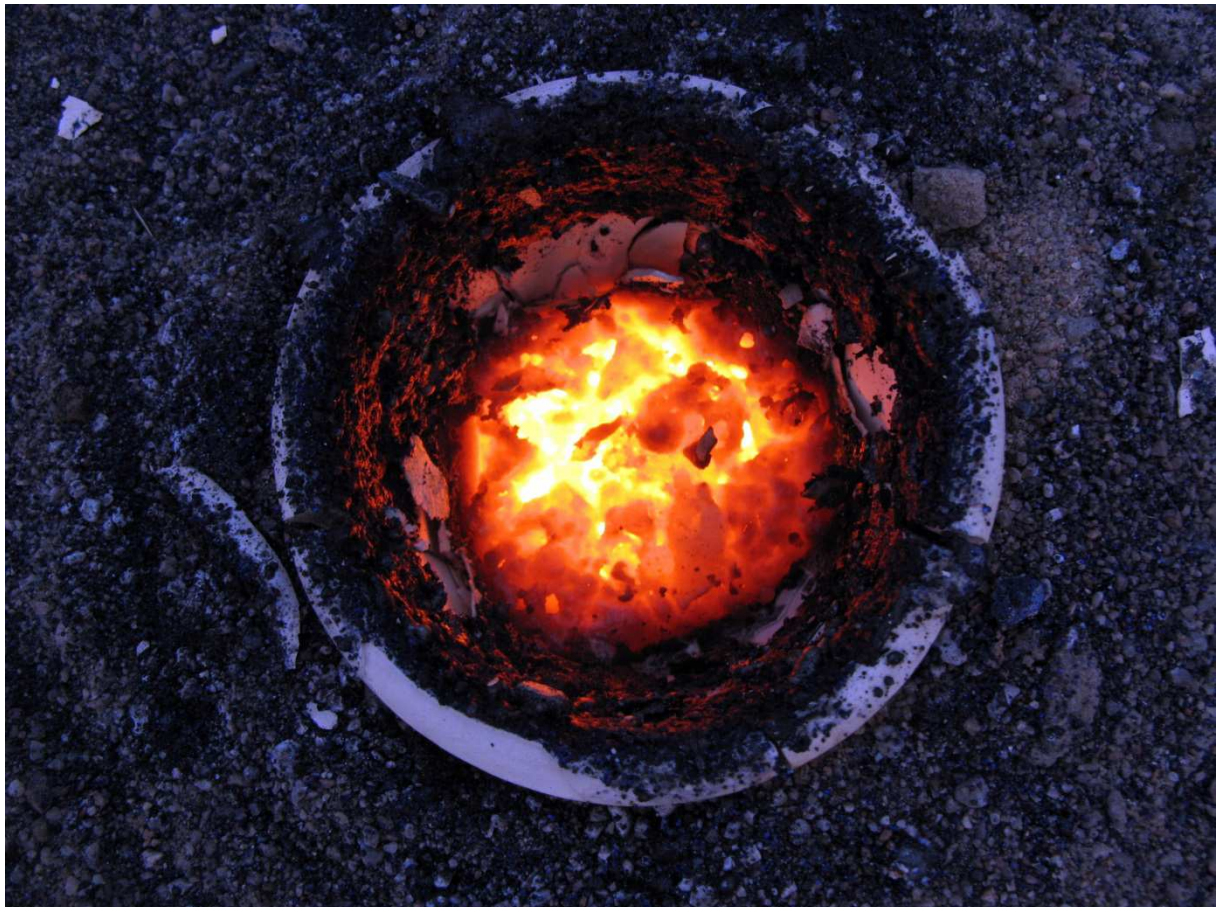
Cobalt thermite with cobalt(II) oxide.

Seinen Namen hat das Kobalt von den Kobolden. Die Bergleute machten Erdgeister für den unangenehmen Geruch verantwortlich, der beim Rösten der Erze entstand. Die Kobolde hätten das wertvolle Silber gefressen und wertlose Erze wieder ausgeschieden.