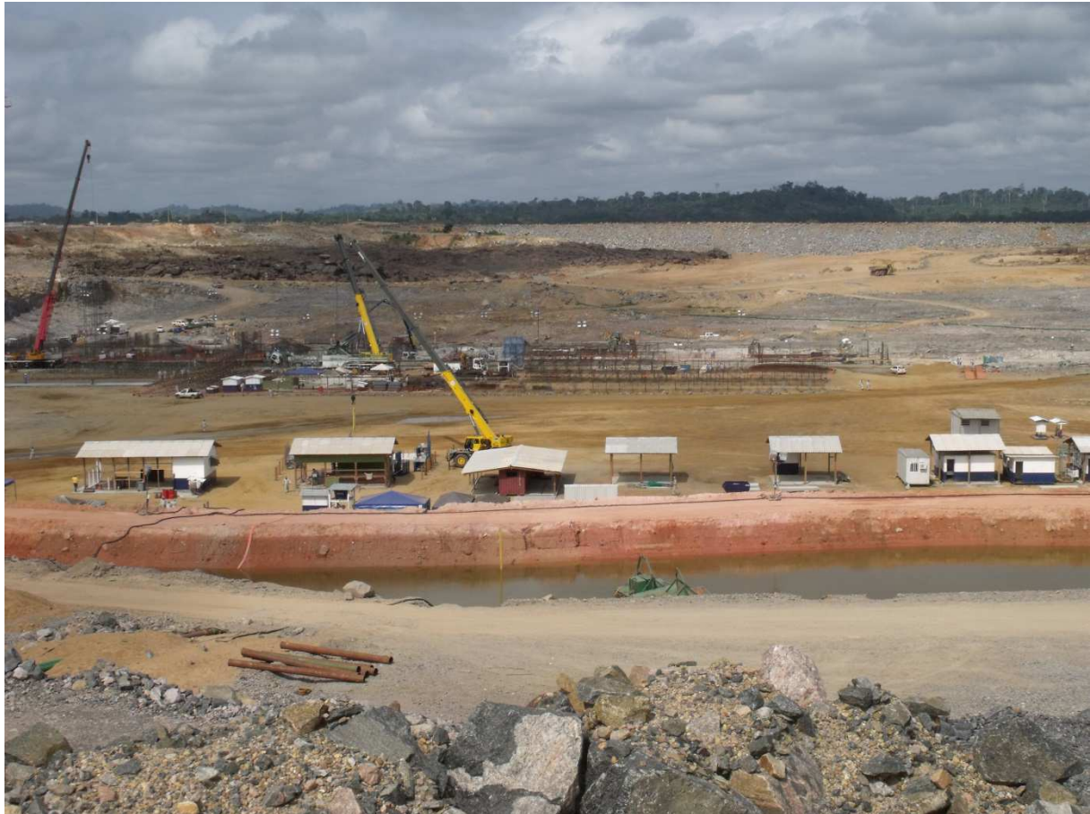
Brasilien, Staudammbau Belo Monte.

Um eine Tonne Aluminium herzustellen, werden 15 Megawatt-Stunden Strom benötigt – so viel wie ein Zwei-Personen-Haushalt in fünf Jahren nutzt. Für den billigen Strom sorgen wiederum gigantische Kraftwerke, die ebenfalls oft Mensch und Natur gefährden.