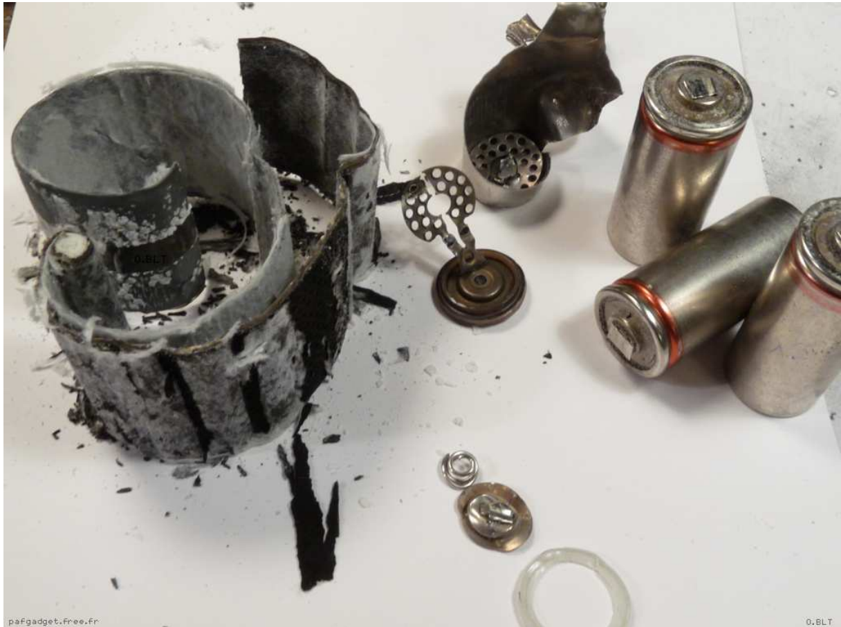
Batterie rechargeable Ni-Cd.

Im Mobiltelefon kommt Nickel nicht nur in den älteren Batterien vor. Es wird auch auf der Platine, im Gehäuse und im Headset verwendet. Nicht wenige Menschen reagieren allergisch auf ihr Nickel-Handy.