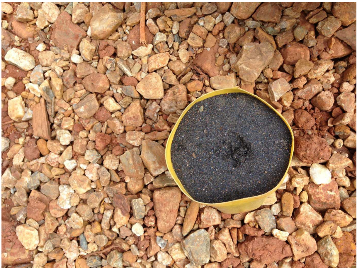
Tantalabbau Bolivien.

Es wird geschätzt, dass sich die größten Tantal-Reserven in Südamerika und in Australien befinden. Im Jahr 2014 waren die Hauptabbauländer Ruanda, Kongo, Äthiopien, Brasilien und Nigeria. 2014 wurden etwa 1.500 Tonnen Tantal abgebaut.