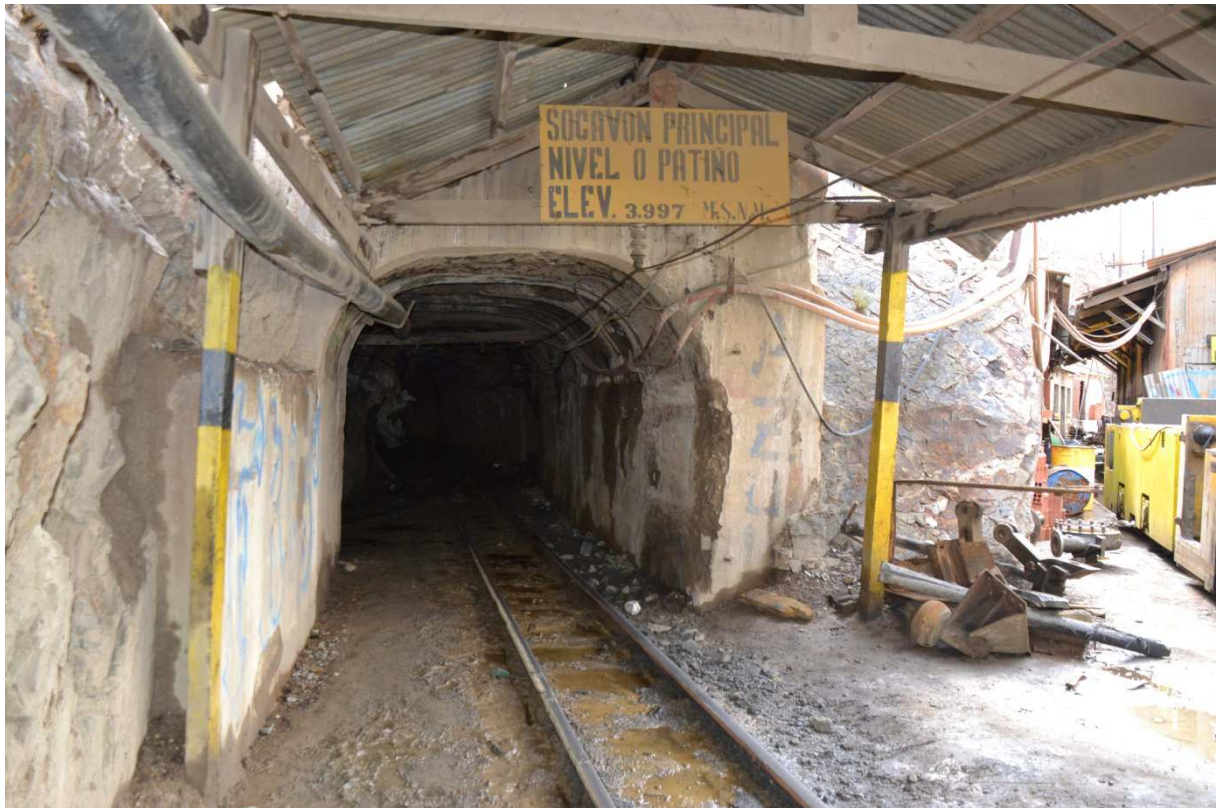
Zinnmine in Huanuni, Region Oruro, Bolivien.

Als Bestandteil von Metall-Legierungen mit niedrigem Schmelzpunkt ist es unersetzbar. Weichlot, so genanntes Lötzinn, wird zur Verbindung elektronischer Bauteile eingesetzt, zum Beispiel auf Leiterplatten. Hochreine Zinn-Einkristalle eignen sich auch zur Herstellung von elektronischen Bauteilen.