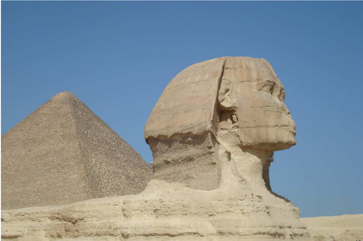
Cheops Pyramide.

In der Industrie ist Kupfer heute eines der am häufigsten verarbeiteten Metalle. Es besitzt hervorragende Leitfähigkeit für elektrischen Strom. Kupfer ist sehr widerstandsfähig und leicht zu verformen.