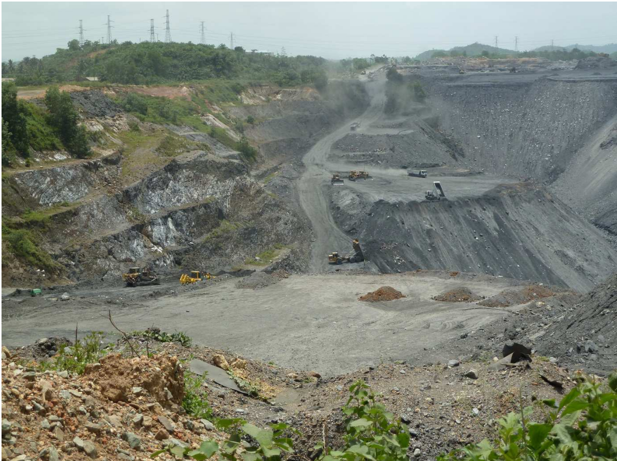
Goldmine Ghana

Weltweit gibt es geschätzt noch 52.000 Tonnen Gold, das profitabel abgebaut werden könnte. Die größten bekannten Vorkommen befinden sich in Australien (7.400 Tonnen), Südafrika (6.000 Tonnen) und Russland (5.000 Tonnen). Wird Gold weiter im derzeitigen Ausmaß abgebaut, sind die Vorräte in etwa 20 Jahren erschöpft.