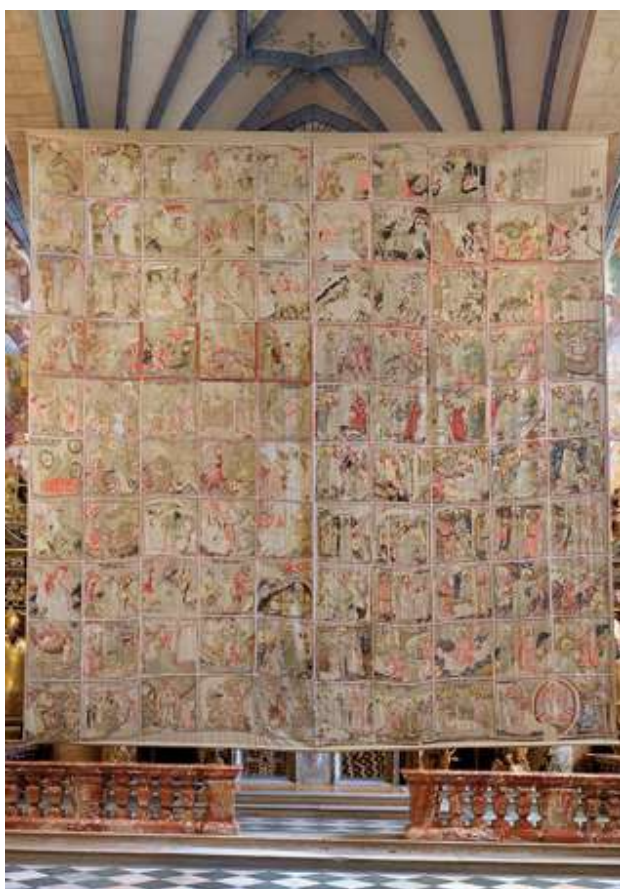
Das Gurker Fastentuch vor dem Hochaltar Hier hängt es 40 Tage vor Ostern.

Damit ihr euch das besser vorstellen könnt, hier ein paar Bilder!