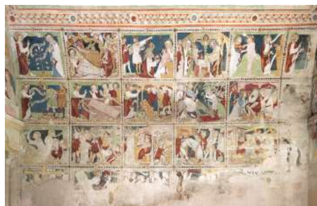
Oben: Altes Testament Unten: Neues Testament Vorhalle im Gurker Dom