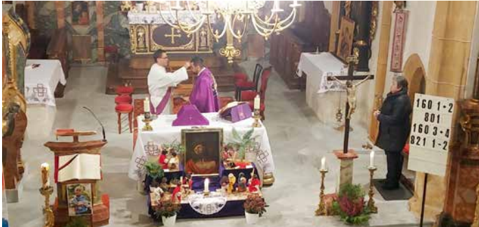
Aschermittwoch (St. Stefan): „Bedenke, Mensch, dass du Staub bist und wieder zum Staub zurückkehren wirst.“