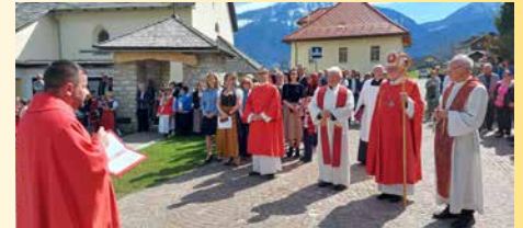
Begrüßung am Kirchenplatz.