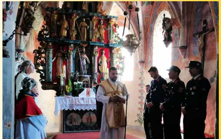
Ostermontag (Steben): „Da gingen ihnen die Augen auf, und sie erkannten ihn.“

Ausführliche Berichte mit vielen Fotos zu diesen Festlichkeiten finden Sie auf den Websites der beiden Pfarren sowie auf der Facebook-Seite von St. Stefan!