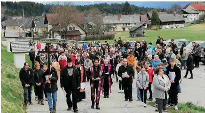
Dekanatskreuzweg (Kalvarienberg): „Im Kreuz ist Heil. Im Kreuz ist Leben. Im Kreuz ist Hoffnung.“