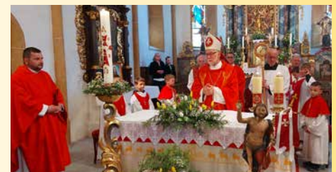
Festgottesdienst in der Pfarrkirche.

Danke für den schönen Tag. Ich habe sehr gerne geholfen.