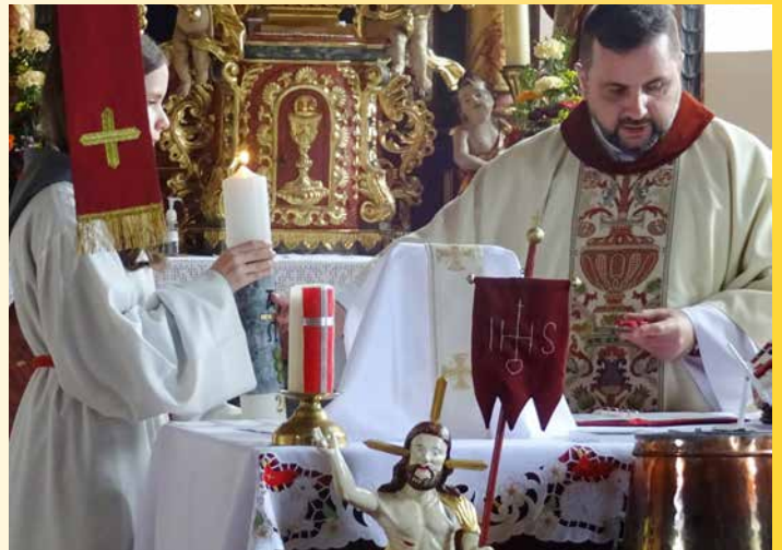
Ostersonntag (St. Paul): „Durch deinen geliebten Sohn steige herab in dieses Wasser die Kraft des Heiligen Geistes.“