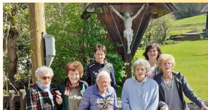
Frauen aus der Ortschaft Sussawitsch treffen sich jährlich zu Floriani beim Dorfkreuz im Ortszentrum, um den Segen für Mensch, Tier sowie Felder und Wiesen zu erbitten.

Zu Floriani, am 04. Mai 2023, fanden Bittprozessionen in mehreren Orten, u. a. in Bach, Karnitzen und Sussawitsch, sowie eine hl. Messe in der Filialkirche Steben statt. Danke für die Gebete in unserem Pfarrverband am Gedenktag des heiligen Florian.