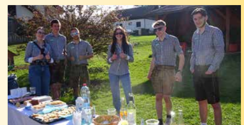
Die Burschenschaft St. Stefan besorgte die Agape.