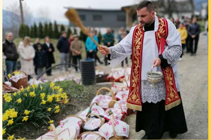
Karsamstag – Speisensegnung (Köstendorf): „Segne dieses Brot, die Eier und das Fleisch und sei auch beim österlichen Mahl.“

Erhaben ist der HERR, denn er wohnt in der Höhe; er hat Zion mit Recht und Gerechtigkeit erfüllt. Jes 33, 5