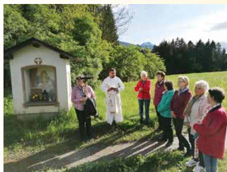
Bitt-Tag in St. Stefan – mit der Prozession von der Waldhauser-Kapelle zur Pfarrkirche.

statt, mit hl. Messen in der Pfarrkirche bzw. der Ferialkirche St. Anton. Danke allen Teilnehmer*innen.