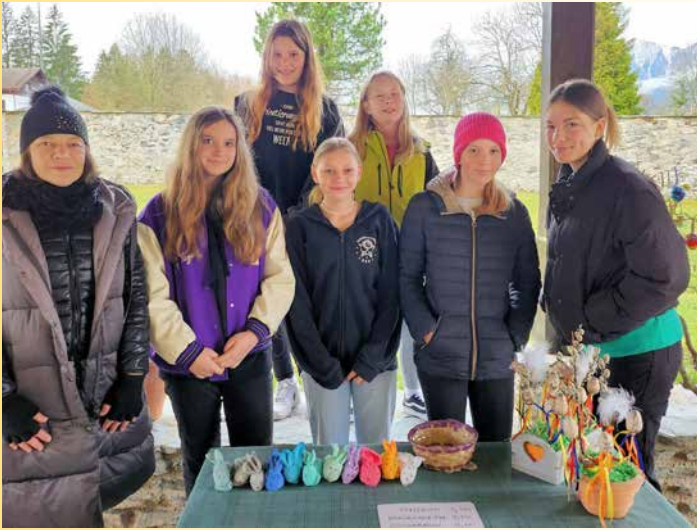
Am 5. Fastensonntag, dem 26. März 2023 umrahmte die Jungschar die hl. Messe mit Liedern und Fürbitten, anschließend gab es den Osterbasar sowie eine Agape.