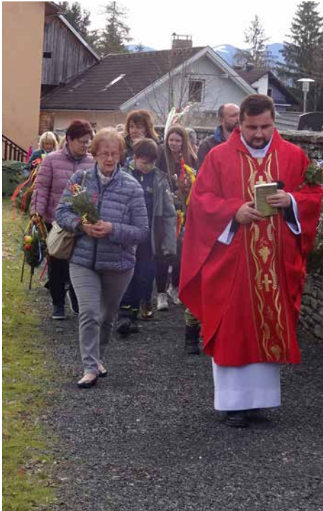
Palmprozession am neuen barrierefreien Zugangsweg zur Pfarrkirche St. Paul.