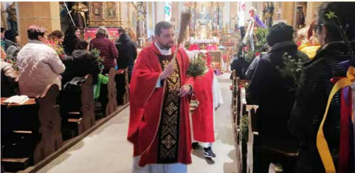
Palmsonntag (St. Stefan): „Gepriesen, der kommt im Namen des Herrn.“

Karfreitag (St. Paul): „Seht, das Kreuz, an dem der Herr gegangen, das Heil der Welt.“