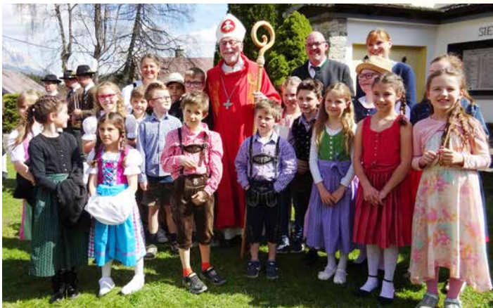
Der Schulchor der Volksschule begrüßt den Bischof.