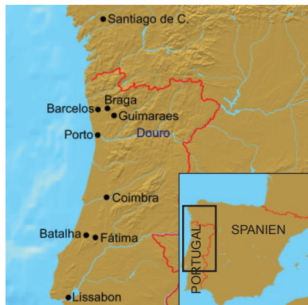
Santiago de Compostela