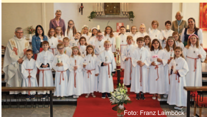
Erstkommunion VS 7