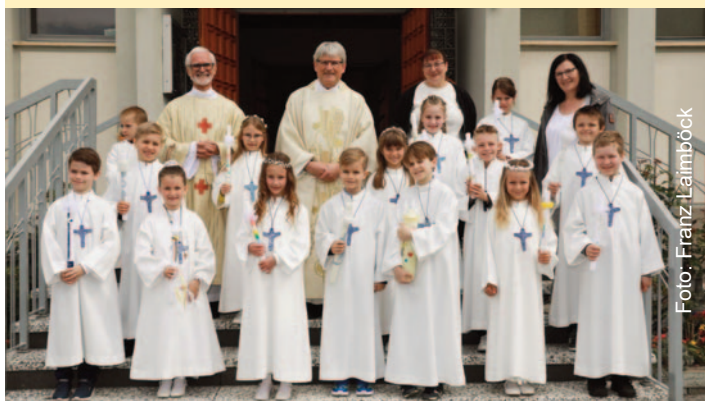
Erstkommunion VS 8

Am 23. April empfangen 14 Kinder der VS 8 zum ersten Mal die Heilige Kommunion, am 30. April war es dann für 29 Kinder der VS 7 soweit. Danke für die Vorbereitung und Gestaltung der beiden Feiern den Religionslehrerinnen Andrea Scheriau und Gerti Winkler! Die Namen der Kinder in alphabethischer Reihenfolge: