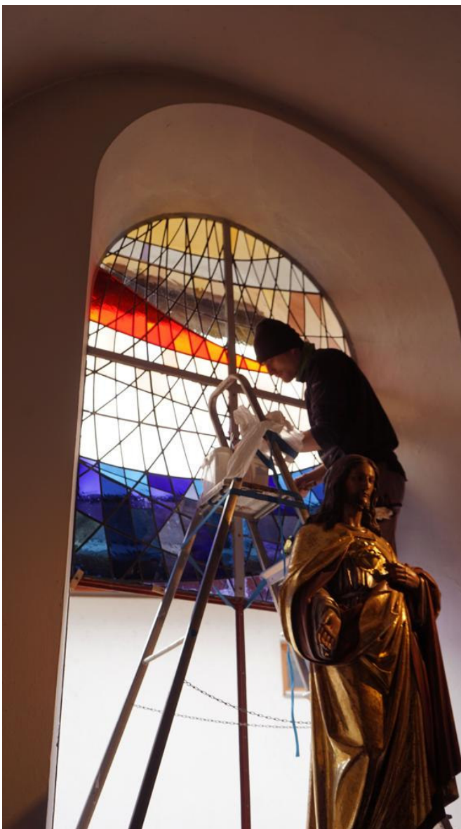
Die MitarbeiterInnen der Glaswerkstätte vom Kloster Schlierbach bei ihrer Arbeit in unserer Kirche