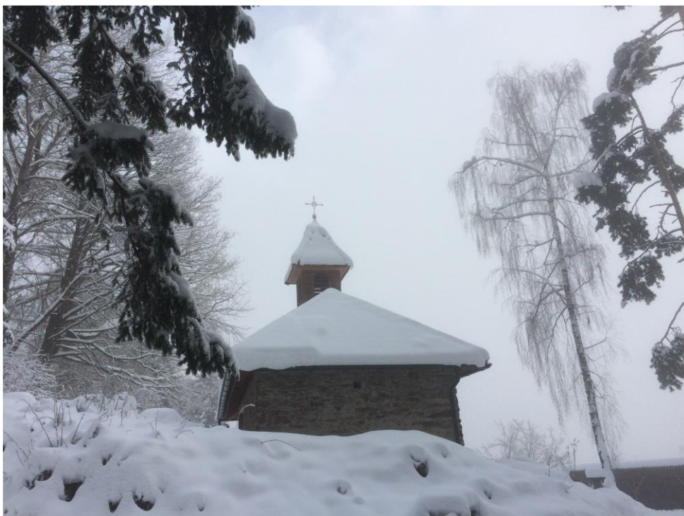
Marienkapelle, Madonna am Walde

Eigentümer, Herausgeber, Verleger: Röm. kath. Pfarramt St. Stefan, Druck: Druck- und Kopiezentrum des Bischöfl. Seelsorgeamtes, 9020 Klagenfurt