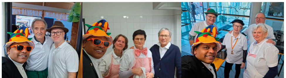
Viele Helferlein ermöglichten einen reibungslosen Ablauf! DANKE!