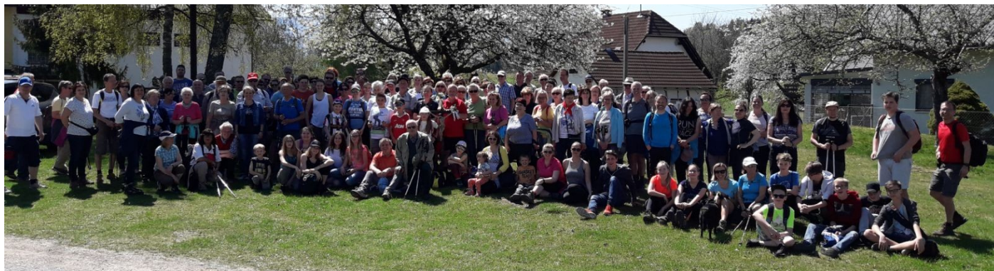
Das war der 3-Kirchen-Pilgerweg 2018