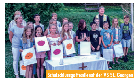
Schulschlussgottesdienst der VS St. Georgen