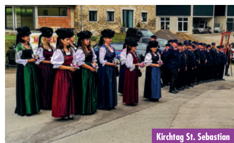
Kirchtag St. Sebastian