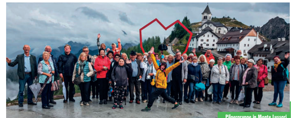
Päigergruppe in Monte Lussari