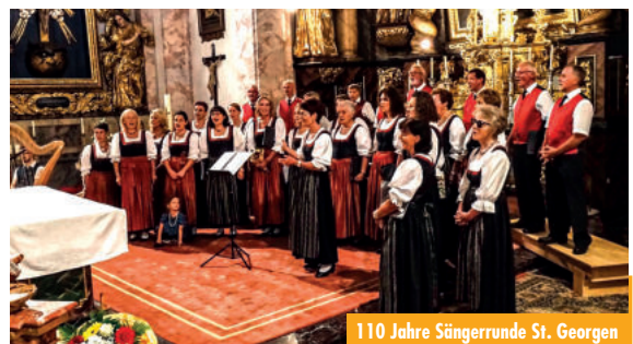
110 Jahre Sängerrunde St. Georgen