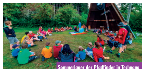
Sommerlager der Pfadfinder in Technua