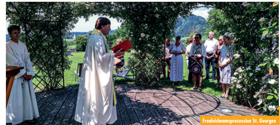
Fronleichnamsprozession St. Georgen