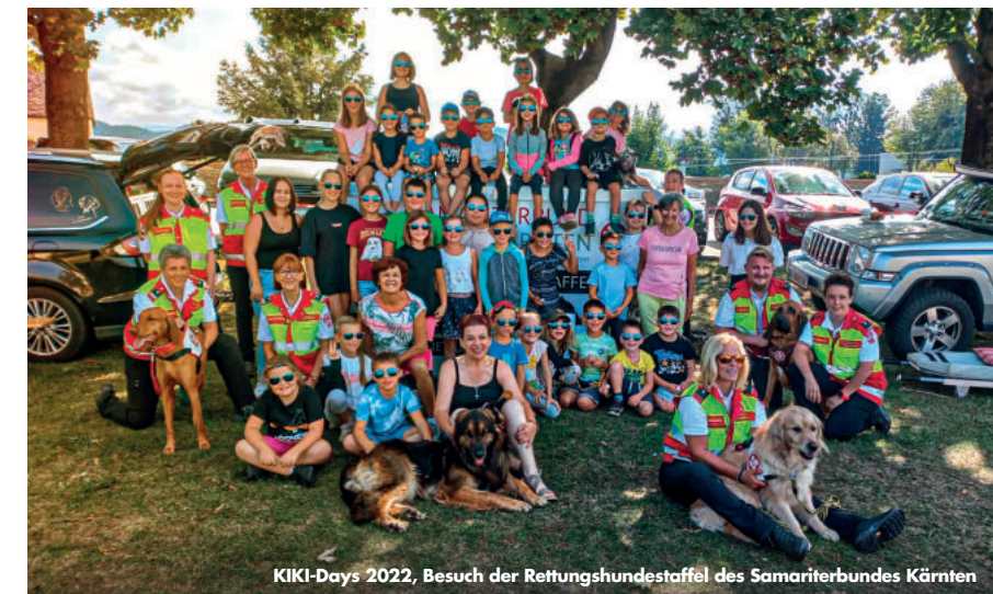
KIKI-Days 2022, Besuch der Rettungshundestaffel des Samariterbundes Kärnten

SONNTAG, 13. NOVEMBER 2022 UM 9.30 UHR IN DER FILIALKIRCHE ST. MARTIN MIT ANSCHL. AGAPE AUF IHR KOMMEN FREUT SICH DAS RENOVIERUNGSKOMITEE ST. MARTIN