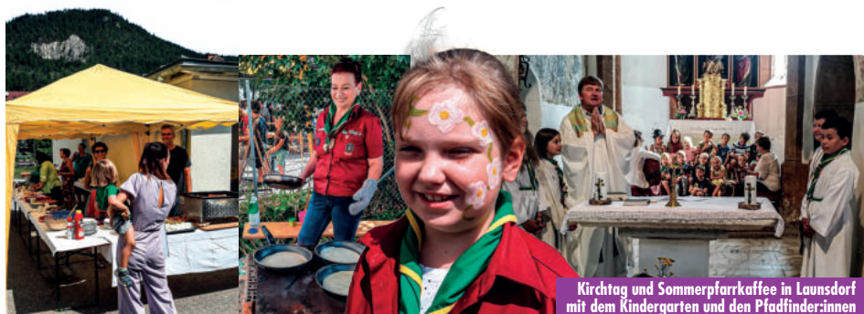
Kirchtag und Sommerfarrkaffee in Launsdorf mit dem Kindergarten und den Pfadfinderinnen

Die Kinder und das Team des Pfarrkindergartens Launsdorf