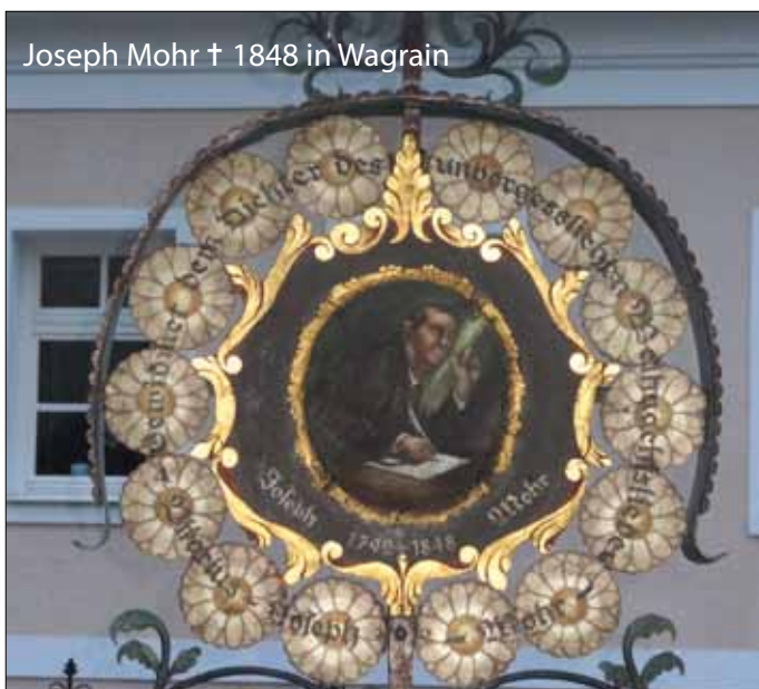
Joseph Mohr † 1848 in Wagrain

Joseph Mohr war in der Zeit von 1816 bis 1818 Vikar in Mariapfarr im Lungau. Inspiriert durch den damals bereits 350 Jahre alten Flügelaltar schrieb Mohr den jetzt in aller Welt bekannten „Stille Nacht“-Text. Maria, die Mutter Jesu, blickt auf die rechte Hand ihres göttlichen Sohnes, die zum Himmel weist. Die Könige als Vertreter der drei Kontinente schreiten zu Christus hin und im Hintergrund stehen bereits Menschen aus aller Welt, die zum Glauben an IHN kommen werden.