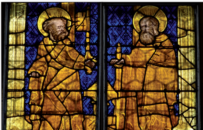
Detail: Petrus und Paulus, Goldfenster Tamsweg