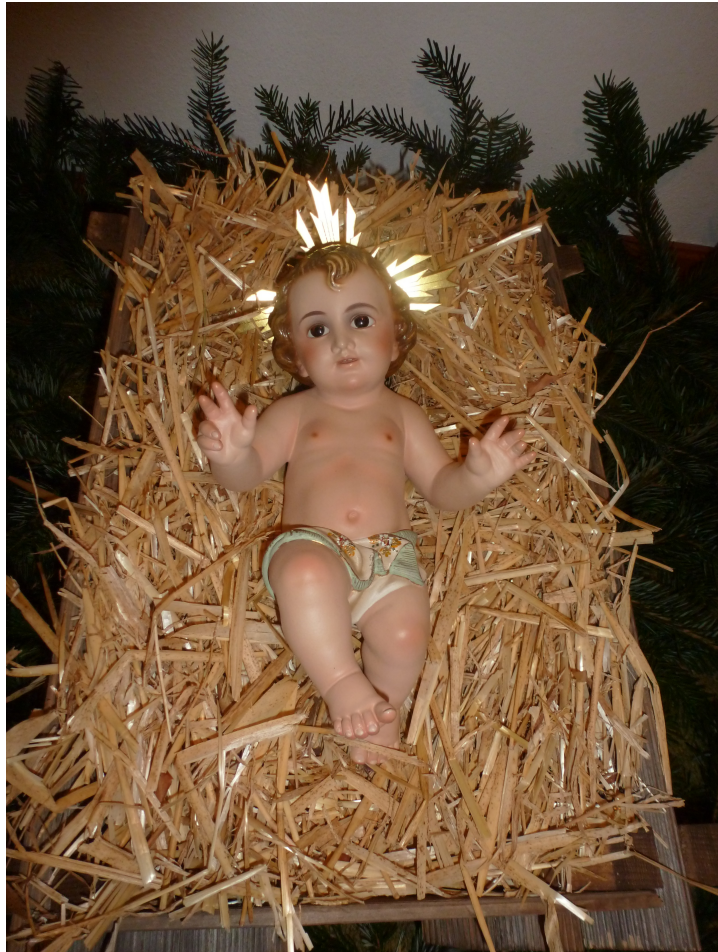
Jesuskind der Kirche St. Margarethen – Hörtendorf