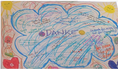
Nach einer Idee unserer Minis konnte jeder Gottesdienstbesucher etwas zum Danke-Plakat beitragen!

Die ersten zwei Gottesdienste waren sehr gut besucht und die Dankbarkeit und das Lob von ganz vielen Besuchern klingt bis heute nach und inspiriert uns, für die kommenden Sonntagsgottesdienste bereits jetzt erste Vorbereitungen zu treffen.