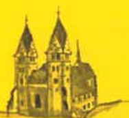
Friesach, Hl. Bartholomäus