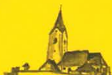
Zienitzen, Hl. Georg