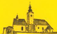
St. Stefan, Hl. Stephanus