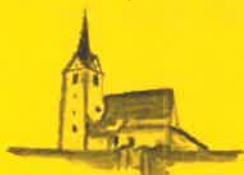
Grafendorf, Hl. Jakobus