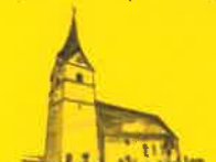
Micheldorf, Hl. Vitus