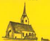
St. Salvator, Hl. Dreifaltigkeit