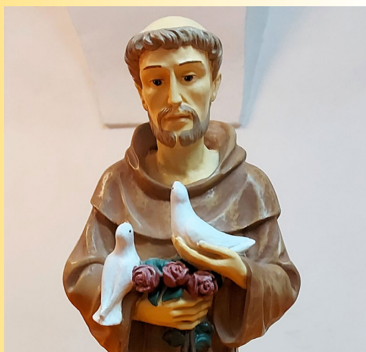
Statue in der Pfarrkirche St. Stefan: Hl. Franziskus mit auf ihm sitzenden Tauben sowie Blumen.

Am 3. Oktober 1226 – vor 800 Jahren – starb der hl. Franz von Assisi .