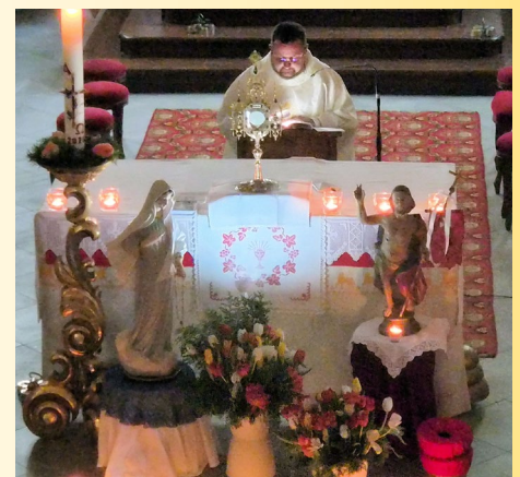
Medjugorje-Andacht im April 2026.

Die Termine für die nächsten Medjugorje-Andachten finden Sie im Pfarrblatt bei den Hinweisen sowie auf den Websites der Pfarren St. Stefan und St. Paul.