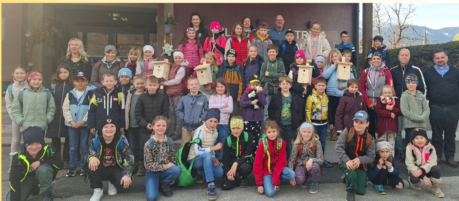
Die Miniranger der Volksschule St. Stefan im Einsatz für die Natur!

Solche wertvollen Erfahrungen stärken das Bewusstsein für die Schönheit und den Schutz unserer Natur.