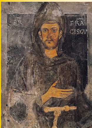
Das älteste, 1228 entstandene Porträt des heiligen Franz von Assisi. Wandgemälde im Kloster Sacro Speco in Subiaco.

Gelobt seist Du, mein Herr, für Schwester Wasser. Sie ist sehr nützlich, und demütig und köstlich und keusch. Gelobt seist Du, mein Herr, für Bruder Feuer, durch den Du die Nacht erleuchtest. Schön ist er und fröhlich und stark und mächtig. Gelobt seist Du, mein Herr, für unsere Schwester, die Mutter Erde, die uns erhält und trägt und vielerlei Früchte hervorbringt mit bunten Blumen und Kräutern. Gelobt seist Du, mein Herr, für alle, die verzeihen aus Liebe zu Dir, und Krankheit und Not ertragen,