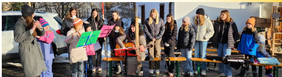
Jungschar beim Auftritt anlässlich des Adventmarktes am 09.12.2023.