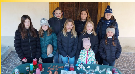
Jungschar – Adventbasar am Christkönigs-Sonntag.

Unsere Jungscharkinder haben wieder fleißig gebastelt und die wunderschönen Dekorationen am 26. November beim Adventbasar nach der hl. Messe und am 09. Dezember 2023 beim Adventmarkt am Kirchenvorplatz angeboten. Beim Adventmarkt haben sie außerdem gemeinsam mit Schülern der Musikschule St. Stefan,