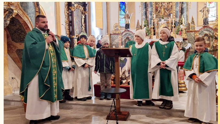
Die Erstkommunionkinder haben bei der hl. Messe am 28. Jänner 2024 gut vorbereitet mit Freude ihren Beitrag geleistet.

nen, von den Kindern selbst verzierten Kerzen gesegnet. Diese sollen bei den täglichen Gebeten mit der Familie angezündet werden.