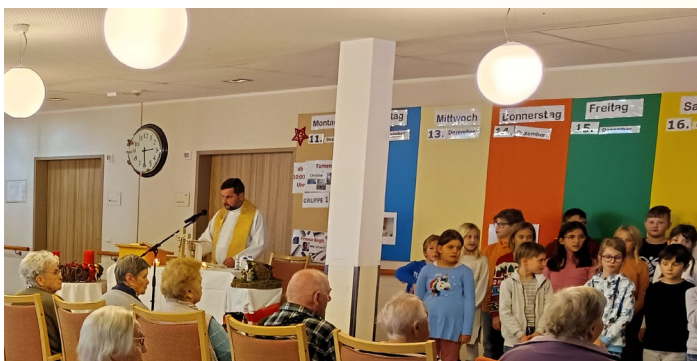
Heilige Messe am 12. Dezember 2023 im AVS-Pflegeheim St. Stefan.

Beim eindrucksvollen Gottesdienst am 12. Dezember 2023 im AVS-Pflegeheim St. Stefan haben Schülerinnen und Schüler vom „ Kinderhaus Kärnten “, der kath. priv. Volksschule