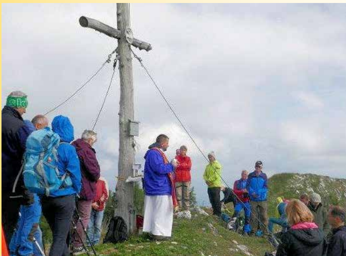
Heilige Messe am Tschekelnock.