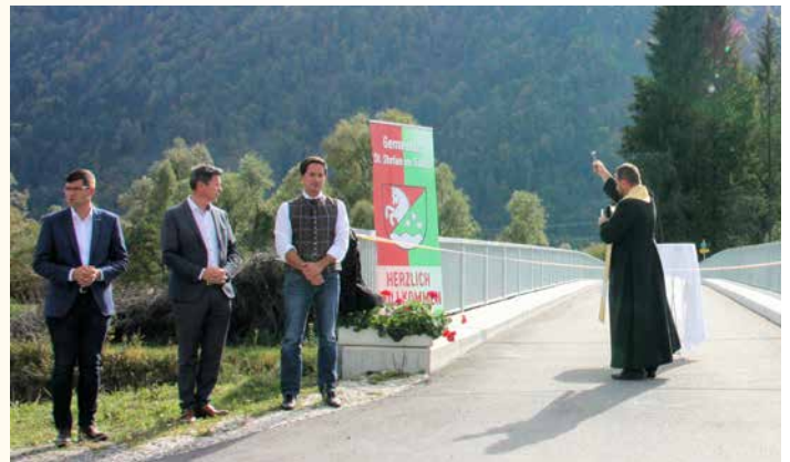
Segnung der neu errichteten St. Pauler Gailbrücke.

„Gott, der allmächtige Vater, segne euch und schenke euch gedeihliches Wetter; er halte Blitz, Hagel und jedes Unheil von euch fern. Er segne die Felder, die Gärten und den Wald und schenke euch die Früchte der Erde.“