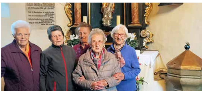
Die Damen aus St. Paul und Umgebung beim Gruppenfoto nach dem Rosenkranzgebet beim Marienaltar.

Am Sonntag, dem 16. Oktober hat Pfarrer Martin als Abschluss der hl. Messe einen Teil des Rosenkranzes gebetet und die Geschichte sowie die Bedeutung dieser Form der Andacht hervorgehoben.