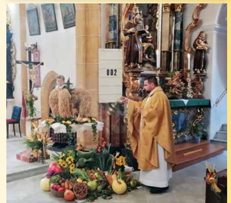
Segnung der Erntegaben in der Pfarrkirche St. Stefan.

Er erbaut seine Hallen im Himmel und gründet sein Gewölbe auf die Erde; er ruft das Wasser des Meeres und giebt es aus über die Erde - HERR ist sein Name. Am, 9, 6