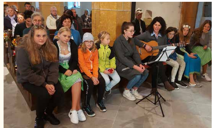
Erntedankfest – musikalische Umrahmung der hl. Messe.