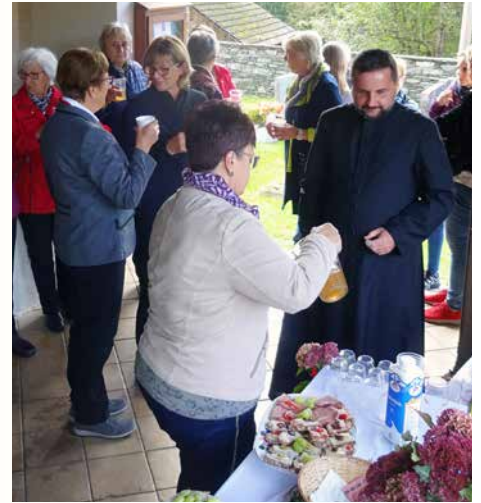
Erntedankfest in St. Paul: Agape nach dem Festgottesdienst.

Erhebt den HERRN, unseren Gott, werft euch nieder an seinem heiligen Berg! Denn der HERR, unser Gott, ist heilig!