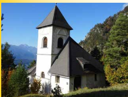
Filial- und Wallfahrtskirche Steben.

Denn siehe: Der HERR geht heraus aus seinem Ort und steigt herab und schreitet dahin über die Höhen der Erde. Mi 1,3