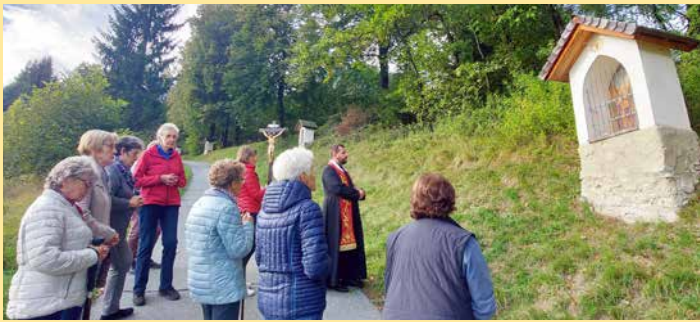
Kreuzwegandacht auf den Kalvarienberg am 17. Sept. 2022.

Bei den Kreuzweg-Andachten betrachten wir gemeinsam das Leiden Jesu und verbinden dieses mit den Lebens- und Leidenswegen der Menschen. Im Pfarrverband St. Paul – St. Stefan kommt diesen Andachten in der Fastenzeit in den Pfarrkirchen und auf den Kalvarienberg – der Dekanatskreuzweg ist der Höhepunkt – eine große Bedeutung zu. Bei der Kreuzweg-Andacht am 17. Sept. 2022, die seit dem Vorjahr am oder um das Fest Kreuzerhöhung abgehalten wird, haben die Gläubigen heuer besondere Gebetsanliegen vorgetragen. Der Ukrainekrieg und die weltweiten Krisensituationen, unter denen viele auch in unserem Land leiden, standen im Mittelpunkt der Kreuzweg-Betrachtungen.