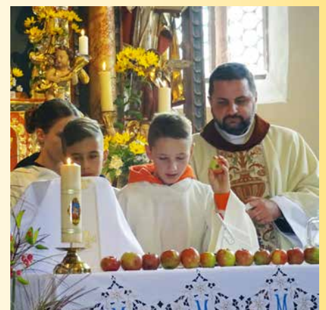
Betrachtungen der Kinder zum Erntedank.