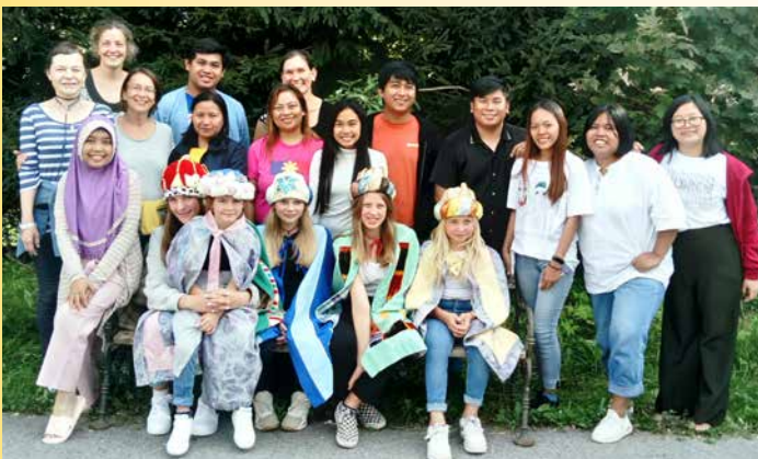
Die philippinischen und indischen Gäste mit den Sternsingern.