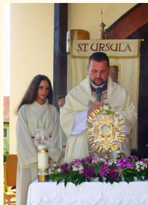
Hl. Messe in St. Paul.

Im Mittelpunkt steht zu Fronleichnam die Verehrung des Leibes und Blutes Christi in Form einer Anbetung. Die hl. Messen unter freiem Himmel waren eine eindrucksvolle Feierstunde zur Ehre Gottes. Sowohl in St. Paul als auch in St. Stefan wurden die hl. Messen vom Blechbläserquintett der Trachtenkapelle Alpenland-Matschiedl musikalisch umrahmt. In St. Paul erfolgte im Anschluss daran das Pfarrfest. Pfarrer Martin dankte allen, die bei den Vorbereitungen und am Hochfest mitgewirkt und teilgenommen haben.