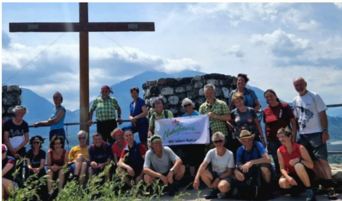
Pilgergruppe auf dem Picotta-Turm.

Pilgerwanderführer Naturfreunde Oberes Gailtal