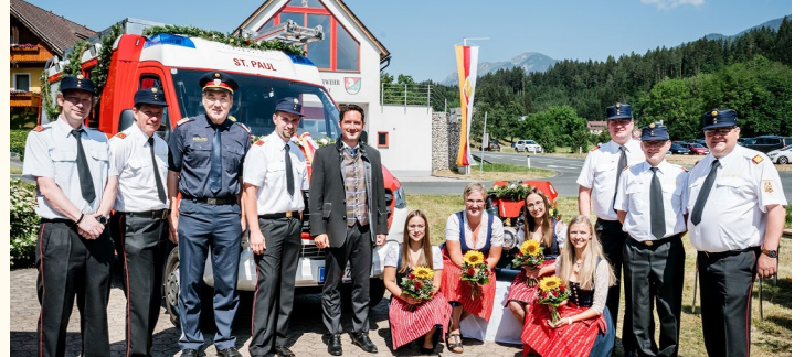
Ehrengäste und Patinnen bei der Feierlichkeit.