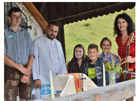
Heilige Messe in der Kapelle auf der St. Stefaner Alm – die Mitwirkenden.