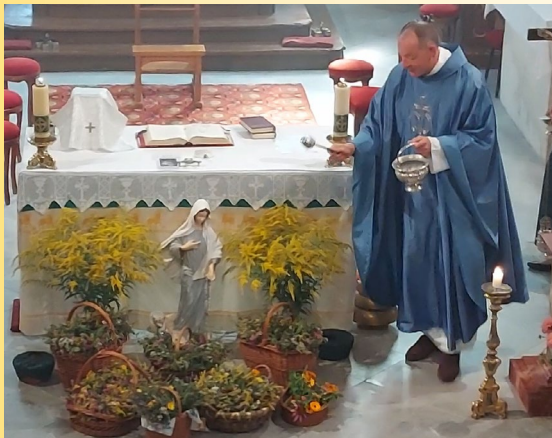
Segnung der Kräutersträußchen, welche traditionell aus 7 oder 9 Kräutern bestehen.