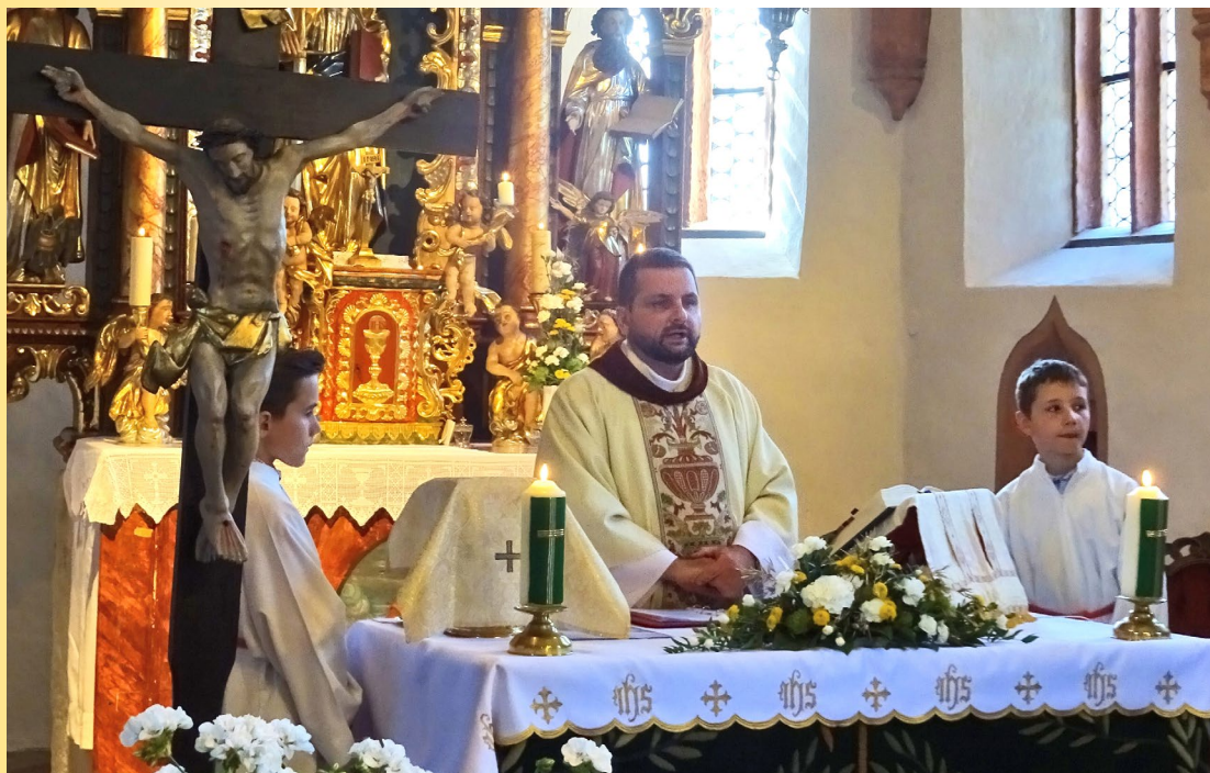
Heilige Messe in der Pfarrkirche St. Paul.