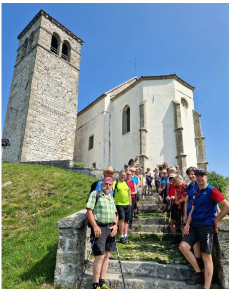
Kirche St. Florian in der Nähe von Tolmezzo.

Zu den heiligen Stätten pilgern, auf dem Weg sein, dem hektischen Alltag entfliehen und sich wieder mit Gott und dem Glauben verbinden, das ist die Motivation für uns Menschen und dies kann sehr heilsam sein.