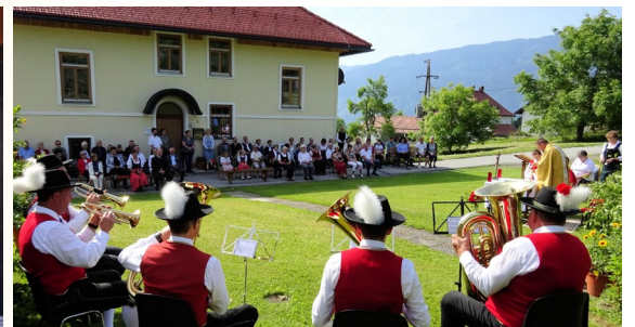
Auch in St. Stefan wurde die hl. Messe im Freien zelebriert.

Wie du dich vor ihnen als heilig erwiesen hast an uns, so erweise dich groß an ihnen vor unseren Augen! Sir 36, 4