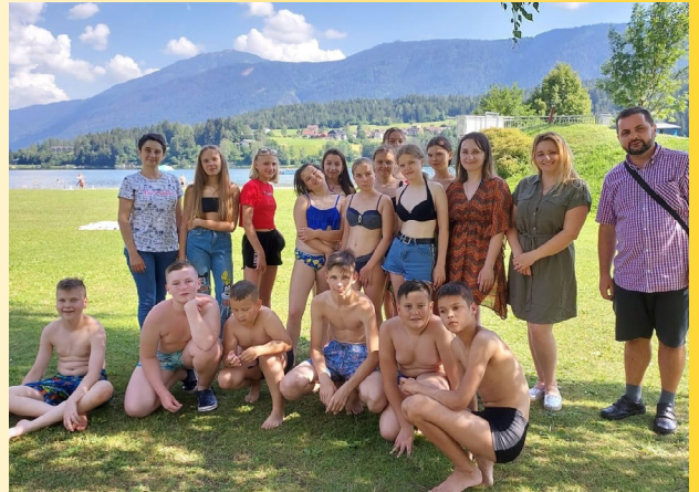
Bei uns konnten die Schüler und Lehrer aus der Stadt Jaworiw glückliche und sorgenfreie Stunden inmitten von Frieden, Herzlichkeit und Freundschaft verbringen.

Womit die Gruppe niemals gerechnet hätte: Mit echter Nächstenliebe, offenen Armen, offenen Herzen und nicht enden wollender Unterstützung. Es war überwältigend, welche Welle an unkomplizierter, schneller und großzügiger Hilfe dieser Gruppe zuteilwurde. Jeder wollte mithelfen, wodurch im Juni 2022 für die Schüler und Lehrer aus Jaworiw eine unvergessliche Woche in Freundschaft, Frieden und Sicherheit organisiert werden konnte. „Unsere Kinder endlich wieder lachen zu hören, tut so unsagbar gut“, erklärte eine Lehrerin mit Tränen in den Augen.