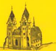
Friesach, Hl. Bartholomäus