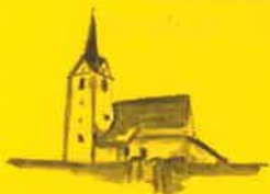
Grafendorf, Hl. Jakobus