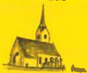
St. Salvator, Hl. Dreifaltigkeit