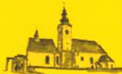
St. Stefan, Hl. Stephanus