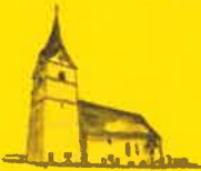
Micheldorf, Hl. Vitus