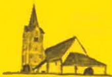
Hohenfeld, Hl. Radegundis