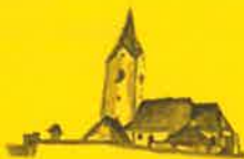
Zienitzen, Hl. Georg