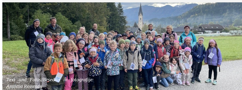
Text und Fotos/Besedilo in fotografije: Antonia Rössman