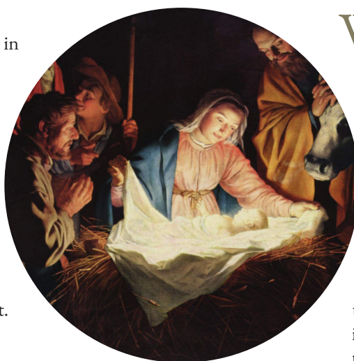
Gerard von Honthorst, Anbetung der Hirten, 1622

Jesus wird geboren in einem Stall. Ein bescheidener Ort für einen großen Herrscher. Der große Gott, der Schöpfer der Welt, offenbart sich in einem kleinen, hilflosen Kind.