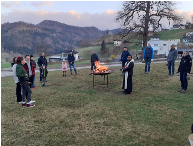
Osterfeierlichkeiten in St. Walburgen