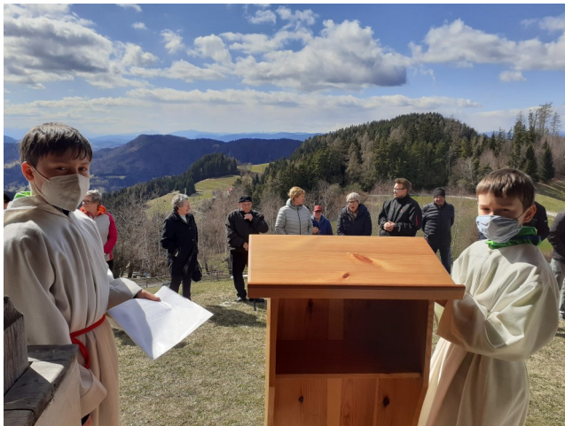
Osterfeierlichkeiten in Mirnig