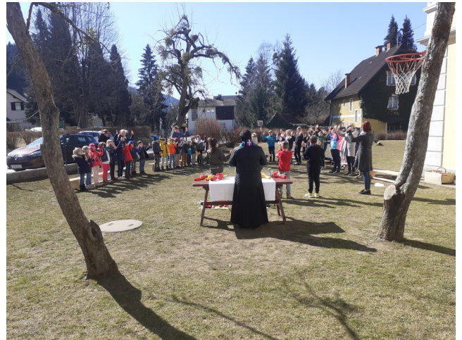
Osterfeierlichkeiten in der VS Eberstein