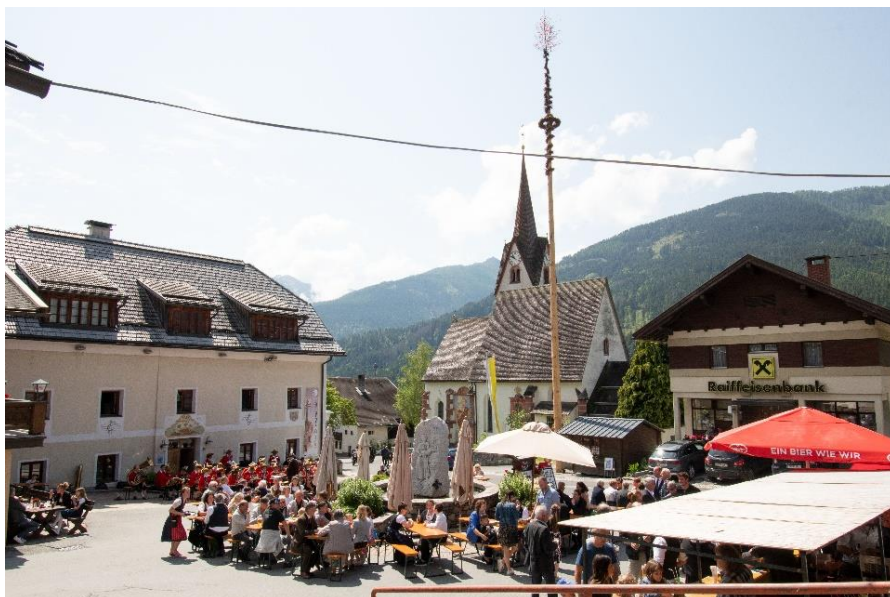
Maibaumfest für die Erneuerungsarbeiten an der Orgel und die Kirchenrenovierung.