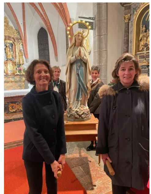
Fatima mit Lichterprozession in St. Jakob 14. Oktober 2023