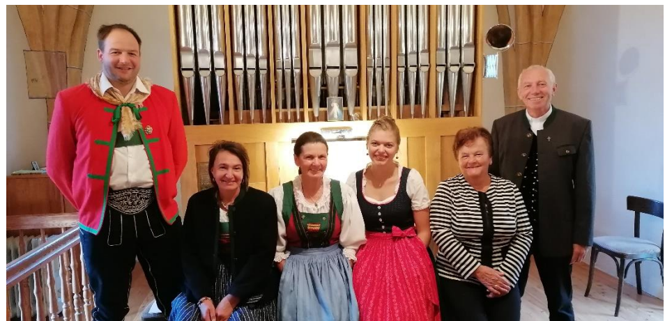
Orgelrestaurierung in Kornat

Kirchenrenovierung in St. Jakob Spendenaktion durch die Ministranten