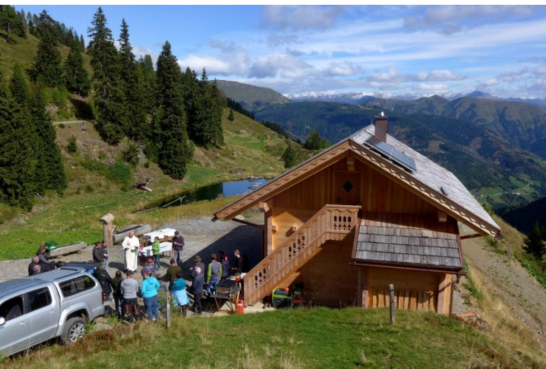
Segnung der Almhütte auf der Niedergaileralm 24. September 2023