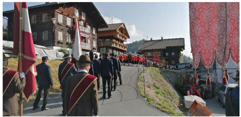
Michaelikirchtag in Kornat 1. Oktober 2023