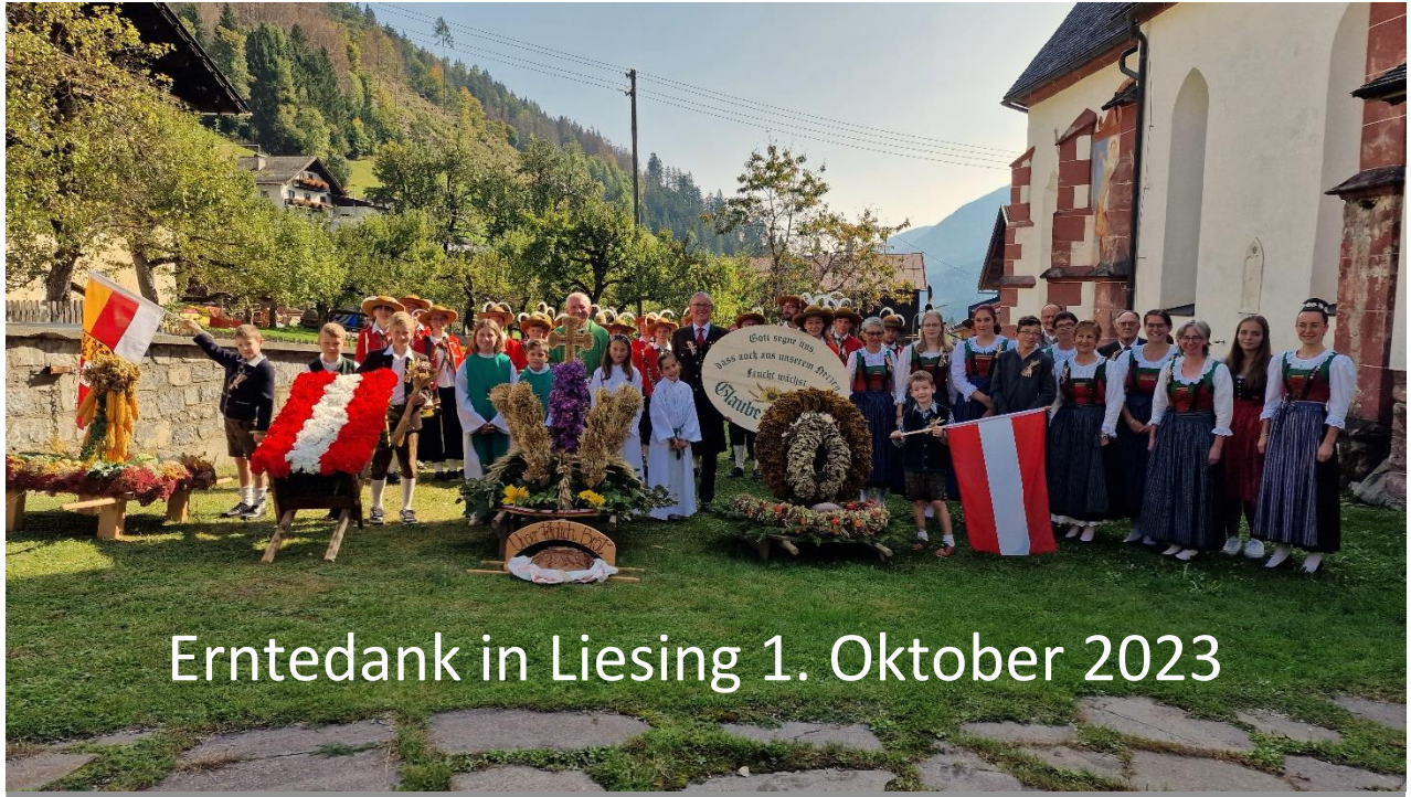
Erntedank in Liesing 1. Oktober 2023