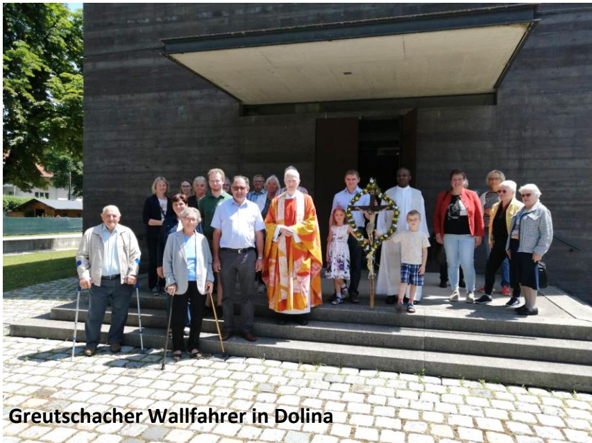
Greutschacher Wallfahrer in Dolina

Auch heuer im Frühjahr hat es wieder die Wallfahrten der Greutschacher auf den Christophberg und nach Dolina sowie nach Maria Hilf und nach Maria Waitschach gegeben. Im Namen des Pfarrgemeinderates möchte ich mich recht herzlich bei allen fleißigen Wallfahrern bedanken, die an den Wallfahrten teilgenommen haben.