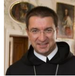
Erzabt Korbinian Birnbacher SALZBURG