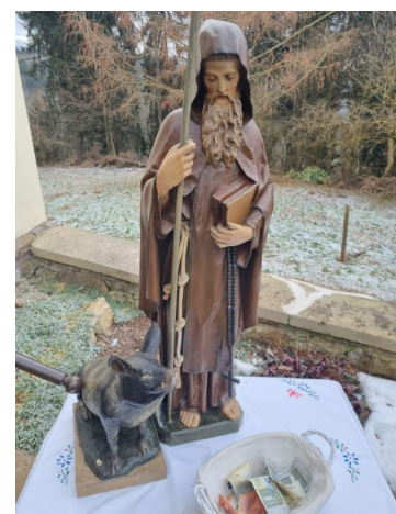
Sau Toni - Reideben