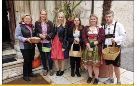
Erntedankfest – Impressionen 2017