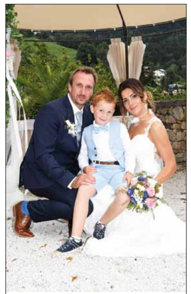
HZ Stockinger & Haag