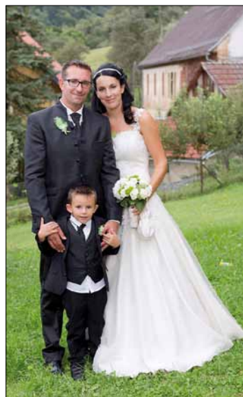
HZ Bitesnich & Mühlak