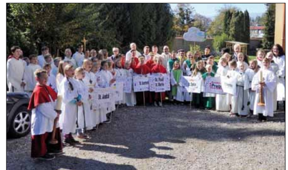
Ministrantentreffen 2017 im Haus St. Benedikt