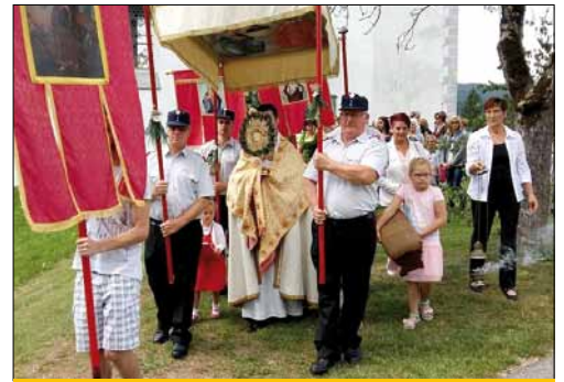
Umgang in St. Margarethen