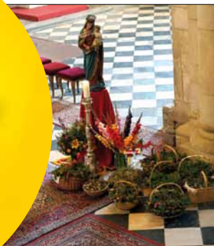
Kräuterfest am „Großen Frauentag“