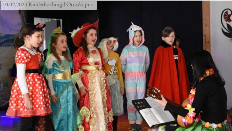
10.02.2023 Kinderfasching | Otroški pust