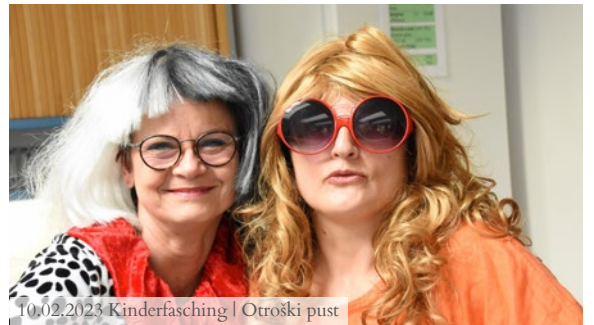
10.02.2023 Kinderfasching | Otroški pust