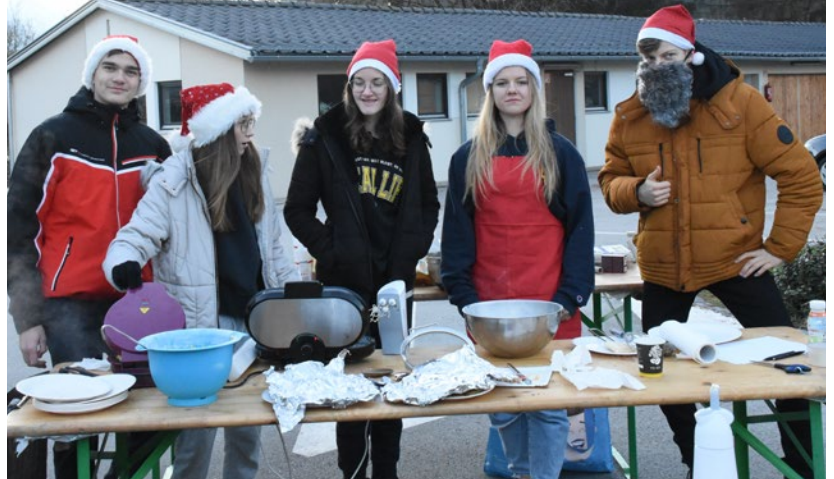
02.01.2023 Hl. drei Könige | Sv. trije kralji