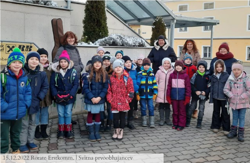
15.12.2022 Rorate Erstkomm. | Svitna prvoobhajancev