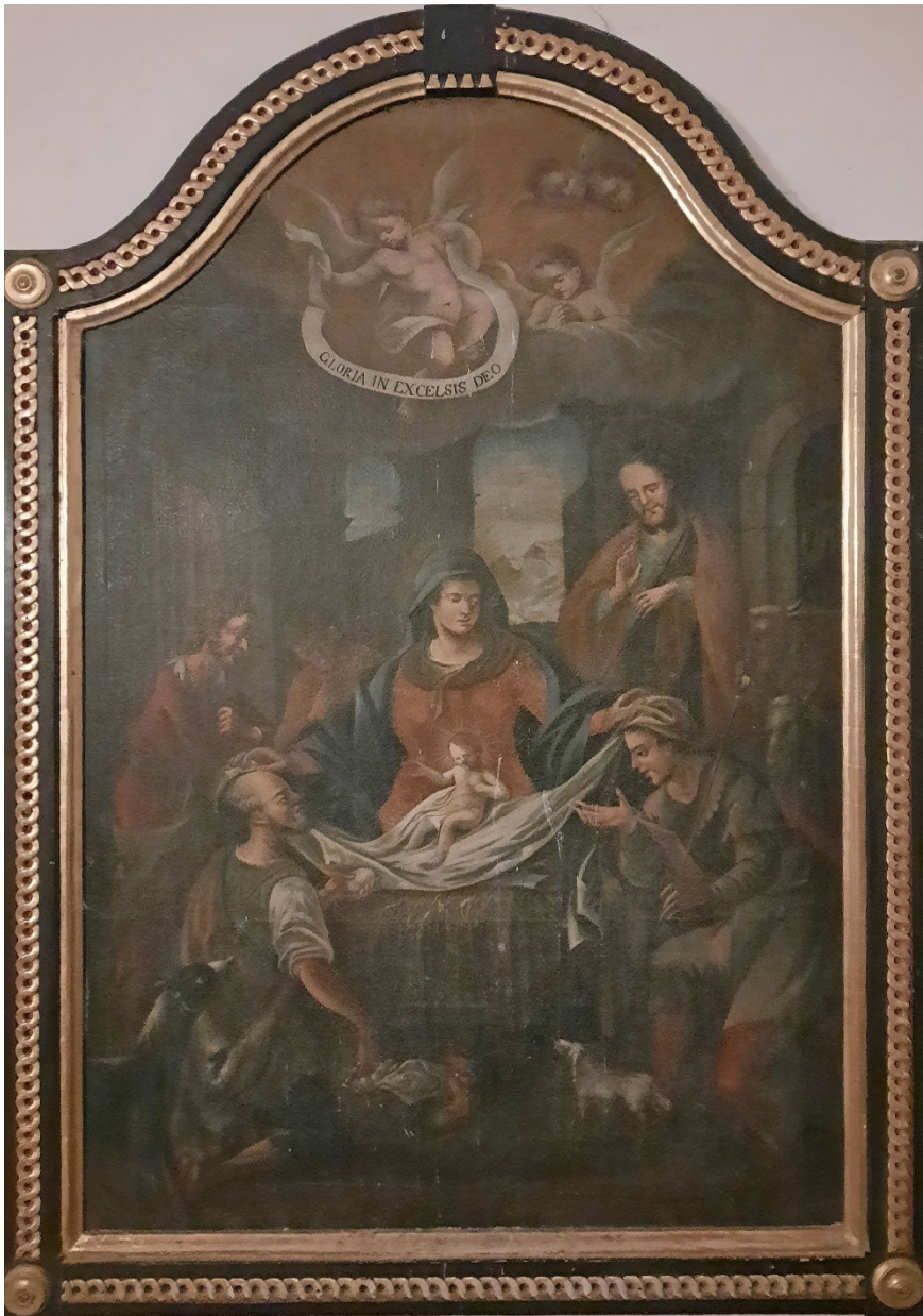
Weihnachtsdarstellung in der Pfarrkirche Schiefeling (Vorkirche) Anbetung des Jesuskindes durch die Hirten (um 1800)