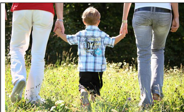
Papst an die Teilnehmer der Familiensynode in Rom 2015: Seid offen für die Realität des Lebens!