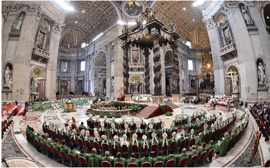
Familiensynode in Rom 2015, Hlg. Messe in Petersdom

Vom 4. bis 25. Oktober haben rund 300 Bischöfe in Rom zum Thema "Die Berufung und Sendung der Familie in Kirche und Welt von heute" beraten. Österreich war durch Bischof Benno Elbs und Kardinal Christoph Schönborn vertreten.