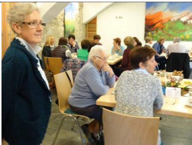
Biofares Frühstück im Pfarrstadl Maria Rojach