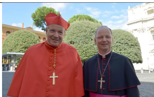
Kardinal Christoph Schönborn und der Vorarberger Bischof Benno Elbs