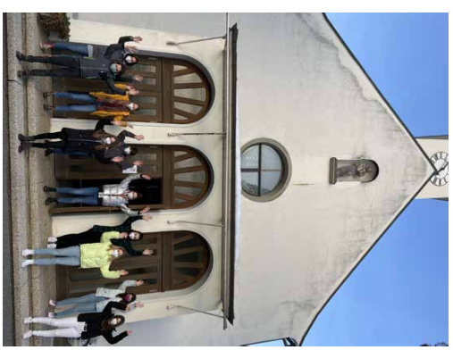
Foto: Symbole für Gott

Gott ist für mich ... heilig barmerzig Beschützer Liebe Himmel Trost Hoffnung weise allwissend unvorstellbar groß gerecht unverstänglich eine Zuflucht alles und nichts (Gedanken der Jugendlichen)