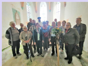
Bittprozession St. Willibald