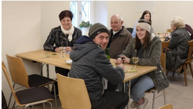
Fastensuppenessen und PGR Wahl in Flattach