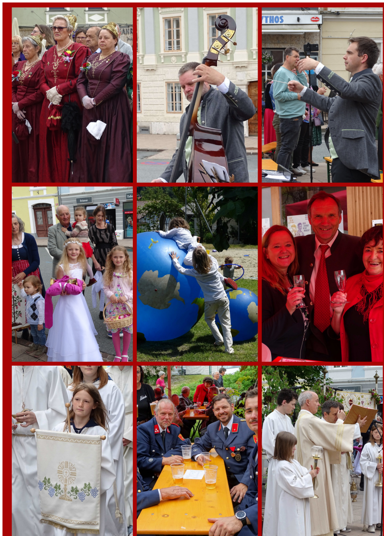
FRONLEICHNAM FESTGOTTESDIENST AM HAUPTPLATZ UND PFARRFEST

Nicht nur, wie hier, beim Pfarrfest, sondern wann immer Hilfe in der Pfarre benötigt wird, sind unsere Helferinnen zur Stelle. Dafür ein herzliches Dankeschön!