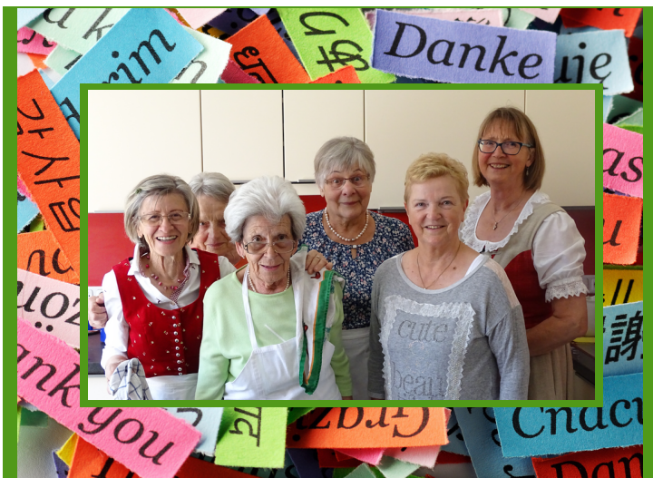
Immer einsatzbereit-unsere Helferinnen

Nicht nur, wie hier, beim Pfarrfest, sondern wann immer Hilfe in der Pfarre benötigt wird, sind unsere Helferinnen zur Stelle. Dafür ein herzliches Dankeschön!