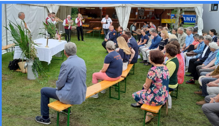
GOTTESDIENST BEIM FEUERWEHRFEST IN ST. ULRICH