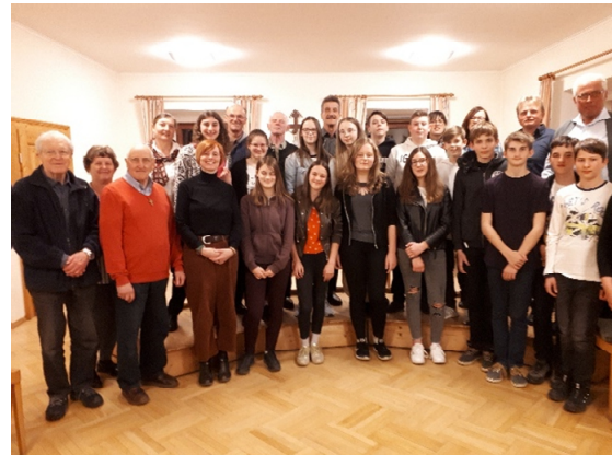
Treffen der Firmlinge mit dem Pfarrgemeinderat