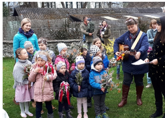
Singgruppe bei der Palmweihe am 14. April