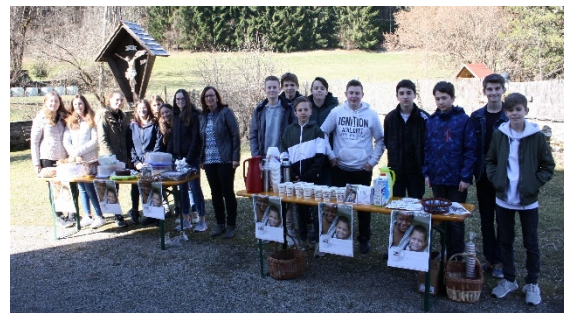
Coffee to help Aktion der Firmlinge am 24. März