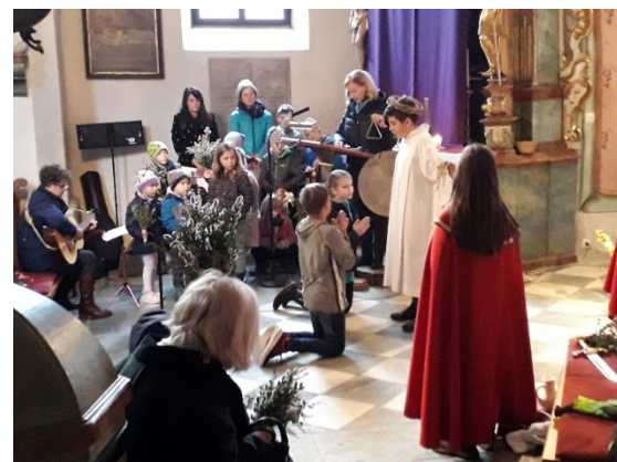
Darstellung der Passion Jesu am Palmsonntag durch Kinder der Volksschule. Musikalische Gestaltung: Siglinde Grabner mit einer Kindergruppe