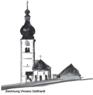
Zeichnung Vincenc Gotthardt