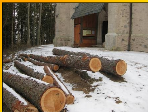
St. Leonhard außen fertig - mehr Luft und Licht - weniger Bäume