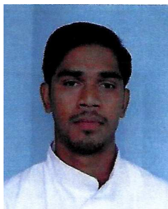
CHANGEMICHERIL Bibin Baby