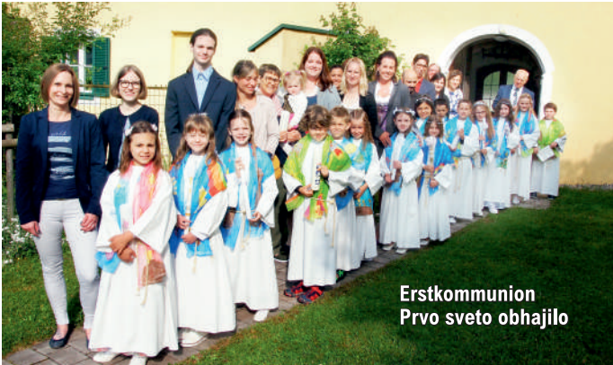
Erstkommunion Prvo sveto obhajilo