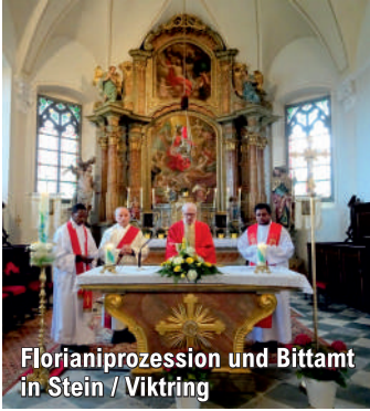
Florianiprozession und Bittamt in Stein / Viktring