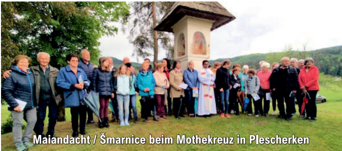
Maiandacht / Šmarnice beim Mothekreuz in Plescherken