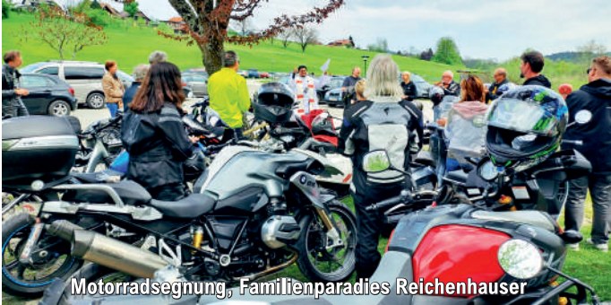
Motorradsegnung, Familienparadies Reichenhauser