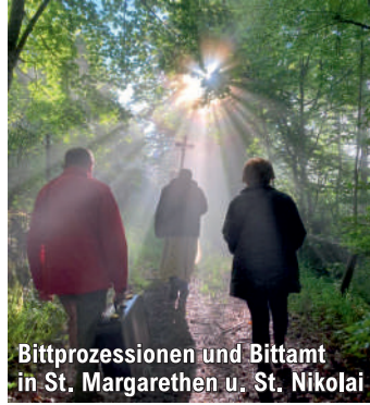
Bittprozessionen und Bittamt in St. Margarethen u. St. Nikolai