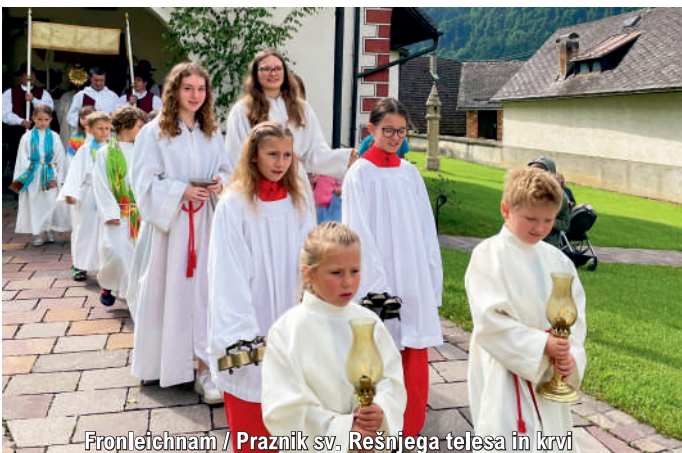
Fronleichnam / Praznik sv. Rešnjega telesa in Krvi

Aktuelles und interessantes (mit vielen Bildern) aus unserer Pfarre finden Sie auf unserer Homepage: www.kath-kirche-kaernten.at/keutschach