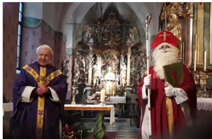
Der Nikolaus besuchte den Gottesdienst am 6. Dez.