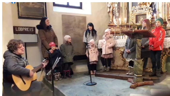
Schöne musikalische Gestaltung am Nikolaussonntag